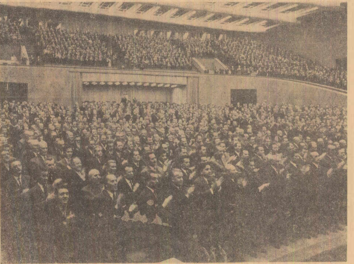
În timpul mitingului