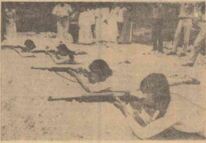
Studente de la universitatea din Hue învață să minuiască armele de tun și le folosesc, împotriva trupelor guvernamentale

— În ce condiții se desfășoară lupta muncitorilor agricoli și ce cuceriri au dobîndit?