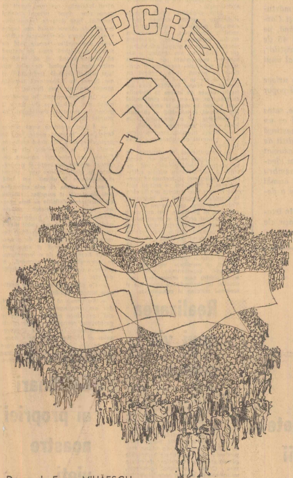
Desen de Eugen MIHĂESCU