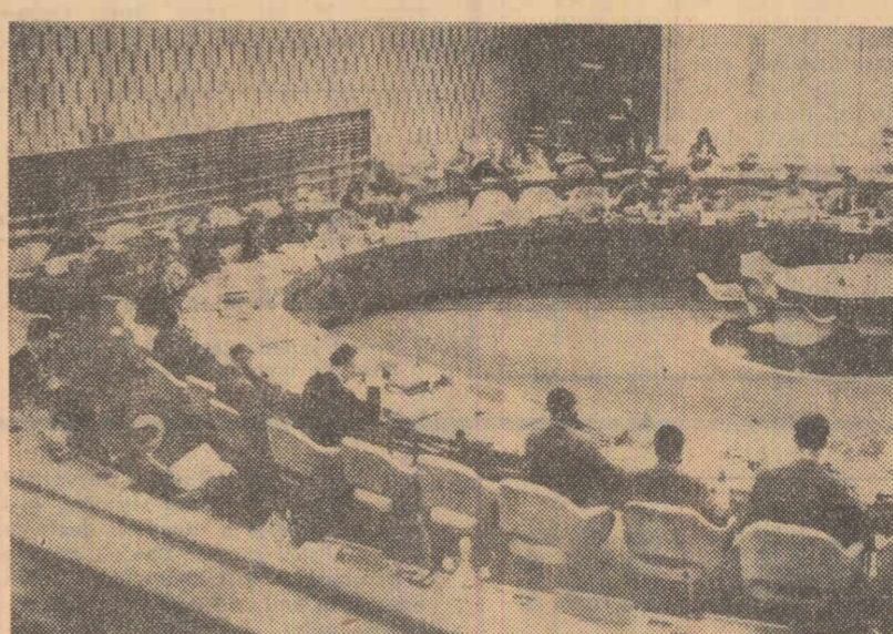
Aspect din sala de ședință.