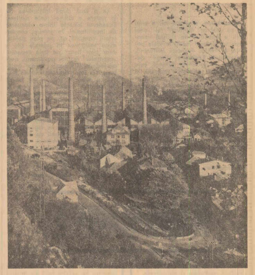
În anii puterii populare, producția industrială a R. S. Cehoslovace a crescut de aproape 5 ori. În special s-au dezvoltat ramurile de bază ca siderurgia, metalurgia, construcția de mașini, producția de energie electrică. S-au construit uzine noi și s-au modernizat cele existente. Numai în ultimul an, producția industrială a crescut cu 11,1 la sută față de 7,8 la sută oțel a reprezentat sporul producției industriale globale. În uzinele siderurgice din țară s-au turnat 8,6 milioane tone oțel. În fotografie: O vedere panoramică a Uzinelor metalurgice Jan Sverma din Podbrzeová.