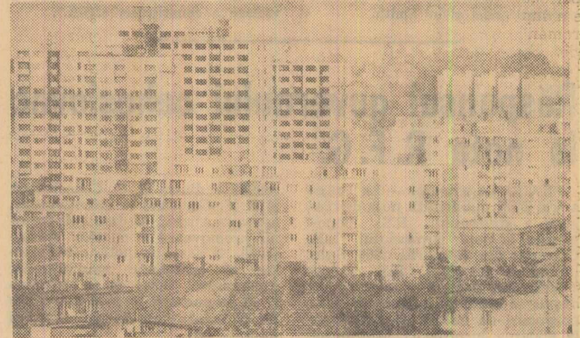
Vedere dintr-un nou cartier al orașului Praga - „Molvla Roșie”