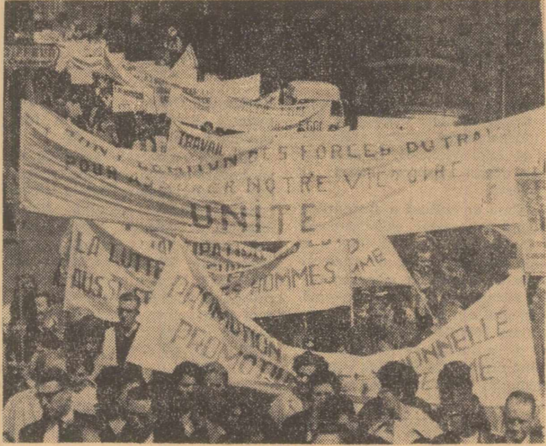
Muncitorii din Liège demonstrează alături de grevistele de la fabrica de armament Heistal

„Această hotărâre — a declarat Gus Hall — este o victorie într-un proces care nu ar fi trebuit să fie intentat, deoarece el constituie o violare a constituției S.U.A.”