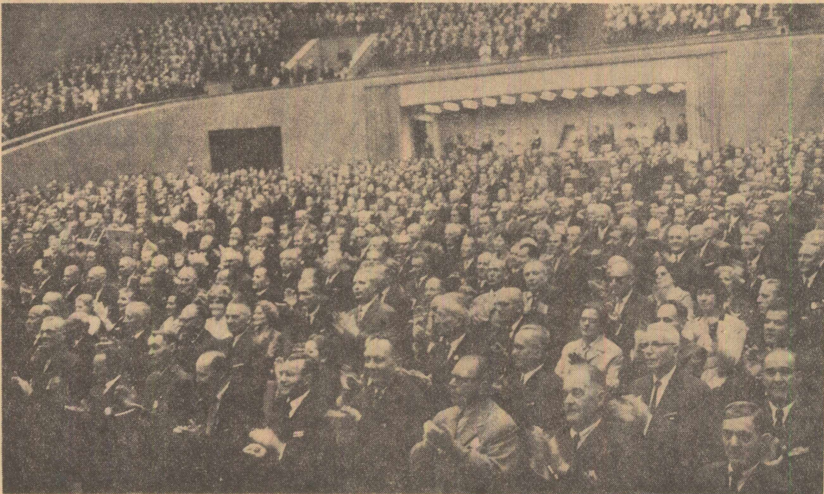
În timpul adunării festive