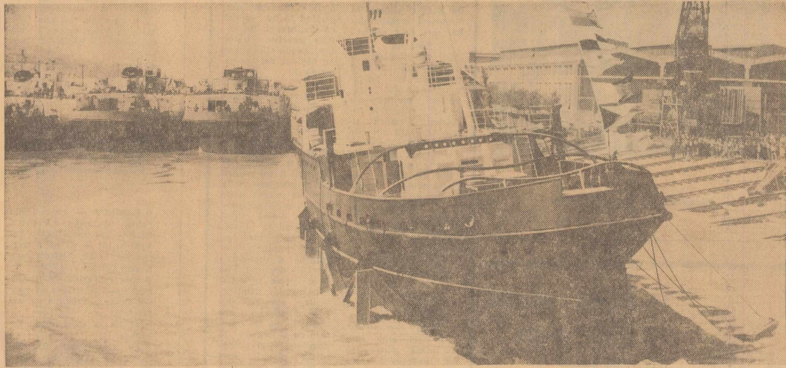
În timpul lansării