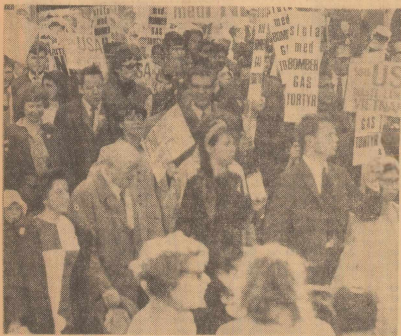
Demonstrație pentru pace la Stockholm

Narciso Ramos, scrie ziarul, s-a pronunțat pentru reducerea termenului de arendă a bazelor americane din Filipine (stabilit pe 99 de ani) și cedarea către Filipine a bazelor maritime militare de la Sengli-Point. Acest acord constituie o pată în constituția țării noastre, a subliniat ministrul de externe filipinez.