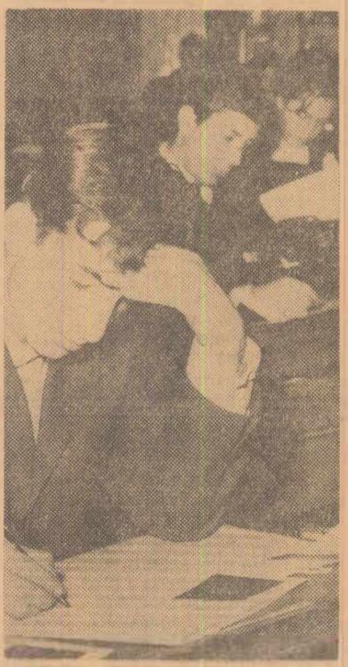
Moment de... concentrare. (La etapa finală a concursului de matematici pe țară au participat 315 elevi)