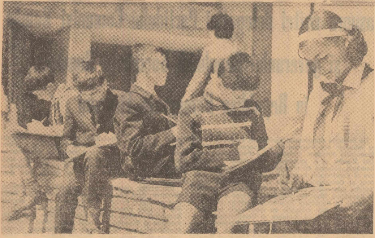
Oră de desen în aer liber