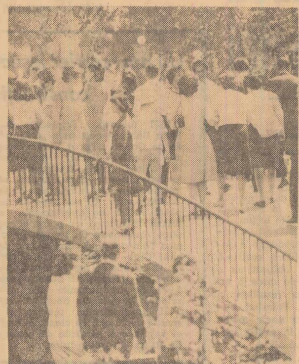
În parc

— Și? — Și containerelor în care au fost transportate aceste țigări au fost umede. Asta că s-au degradat 520 bucăți țigări „Carpați” în valoare totală de 58,83 lei.