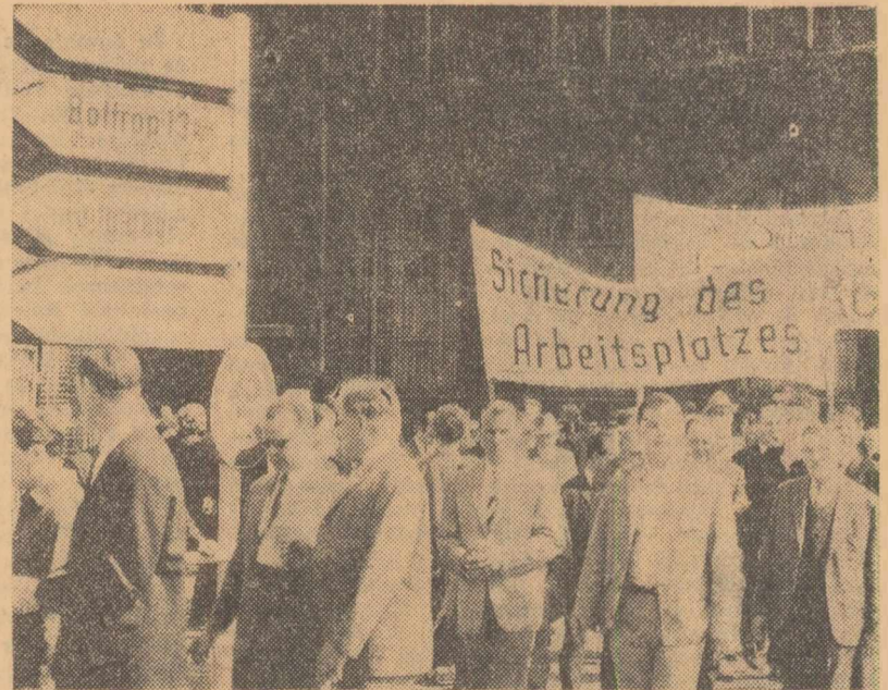
„Garantați-ne dreptul la muncă!” — sub această lozincă minerii din Gelsenkirchen (R. F. Germană) au organizat o demonstrație de protest împotriva închiderii minelor

CIUDAD DE GUATEMALA. Congresul național al Guatemalei a ales pe Julio Cesar Montenegro, lider al Partidului revoluționar, ca președinte al țării pe o perioadă de cinci ani. La cîteva ore după ce Montenegro a fost ales președinte, guvernul guatemalez a decretat stare de asediu pe o perioadă de 30 de zile. Potrivit agențiilor de presă, starea de asediu a fost declarată ca urmare a ră-