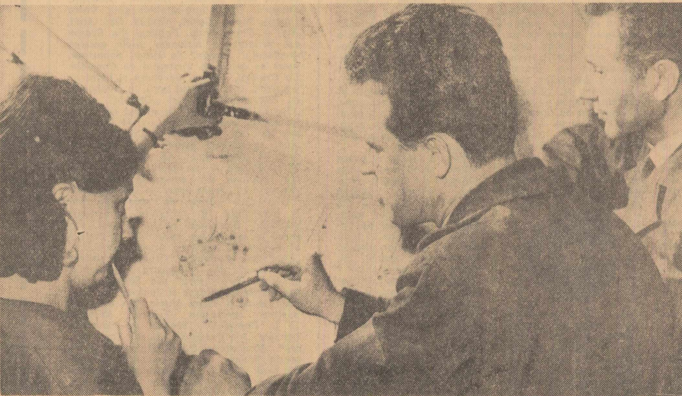
Un colaciu înaintea definitivării oricărei soluții constructive se dovedește deosebit de util

Pe această cale, a folosirii concentratului de fier, furnaliștii de la Hunedoara vor produce în acest an 220 000 de tone de fontă.