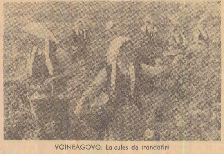
VOINEAGOVO. La cules de trandafiri

In aceste zile culesul și prelucrarea trandafirilor sînt în toi. Unitățile agricole socialiste cultivatoare obțin