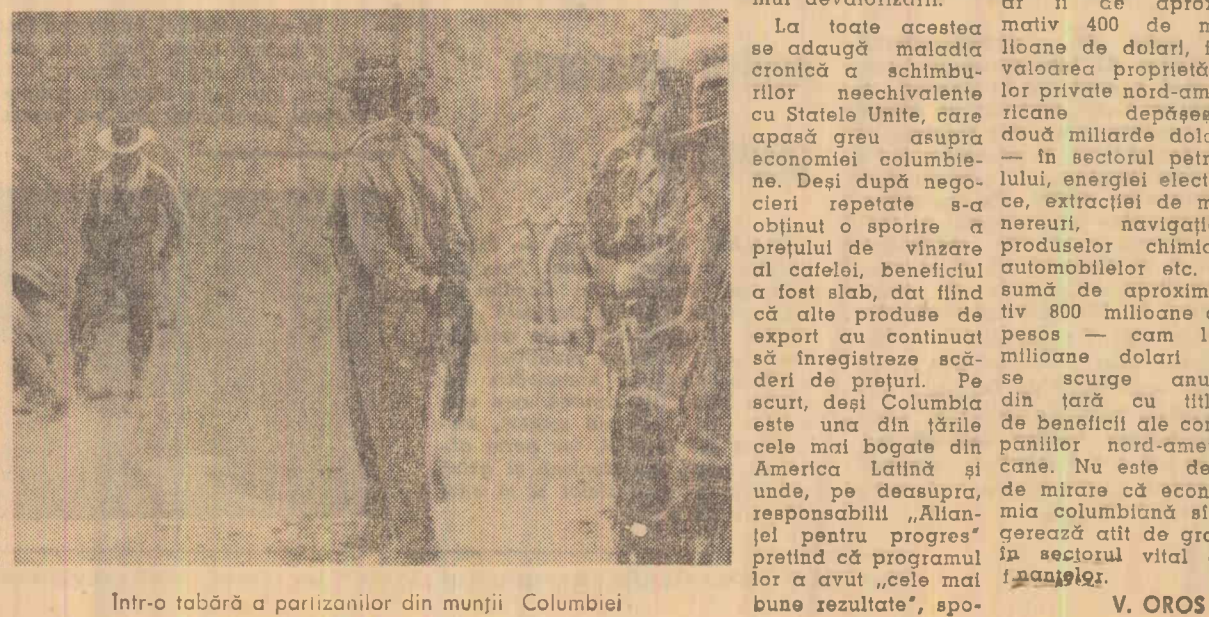
Intr-o tabără a partizanilor din munții Columbiei

La toate acestea se adaugă maldacia cronică a schimbărilor neechivalente cu Statele Unite, care apăsă greu asupra economiei columbiene. Deși după negocierii repetate s-a obținut o sporire a prețului de vânzare al cafelei, beneficiul a fost slab, dat fiind că alte produse de export au continuat să înregistreze scăderi de prețuri. Pe scurt, deși Columbia este una din țările cele mai bogate din America Latină și unde, pe deasupra, responsabilii „Alianței pentru progres” prăvălind ca programul lor a avut „cele mai bune rezultate”, spo-