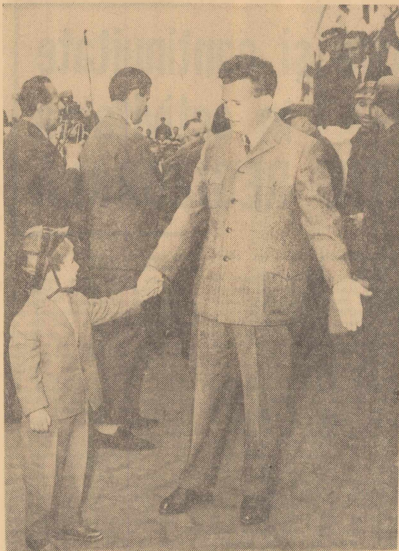
Întîlnire cu un viitor minier

La despărțire, conducătorii de partid și de stat urează succes în munca proiectanților și constructorilor Sucevei socialiste.