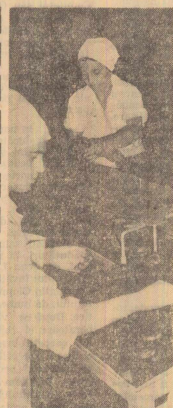
La fabrica de conserve „Flora” a început prelucrarea, în gem și dulceață, o unor cantități mari de cîpsuni, petole detrandafiri și cîreșe