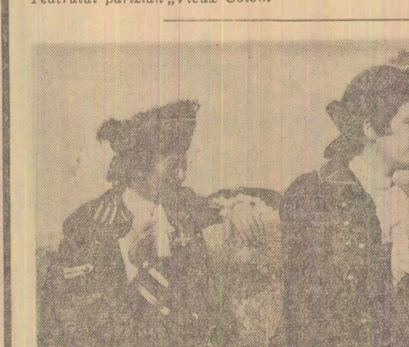
Cadru din filmul „Serbările galante”, coproducție româno-franceză, a căruia premieră va avea loc în această săptămîină

Lunii seara a avut loc pe scena Teatrului „Lucia Sturdza Bulandra” din Capitală primul spectacol susținut de ansamblul Teatrului parizian „Vieux Colom-