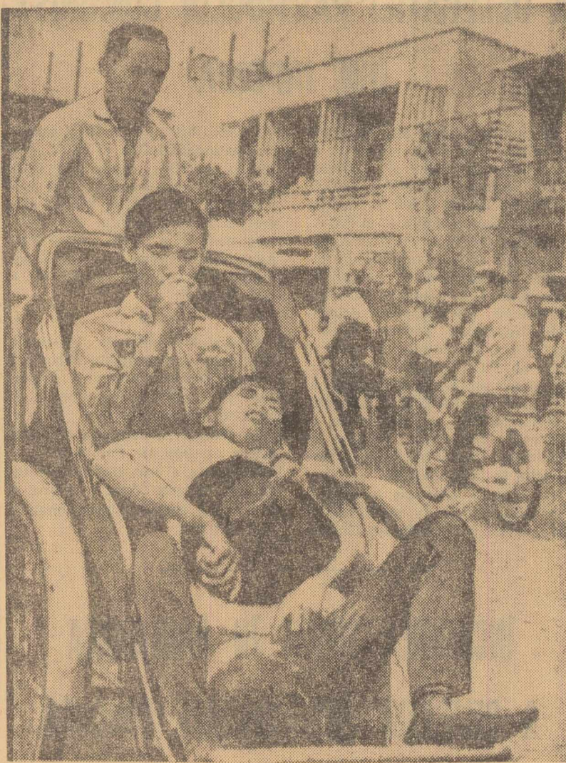
SAIGON. Un tânăr rănit în cursul atacurilor lansate ieri de trupele guvernamentale asupra manifestațiilor

DAMASC 23 (Agerpres). — Primul ministru al Siriei, Youssef Zeayyen, a anunțat formarea unui „Comitet suprem pentru apărarea populară”, însărcinat să întreprindă toate măsurile necesare în vederea preîntâmpinării uneltirilor cercurilor imperialiste împotriva Siriei. Din comitet, care este condus de ministrul apărării, Mohammed Eid Eishawi, fac parte ofițeri superiori, reprezentanți ai gărzii naționale, ai sindicatelor și ai altor categorii sociale.