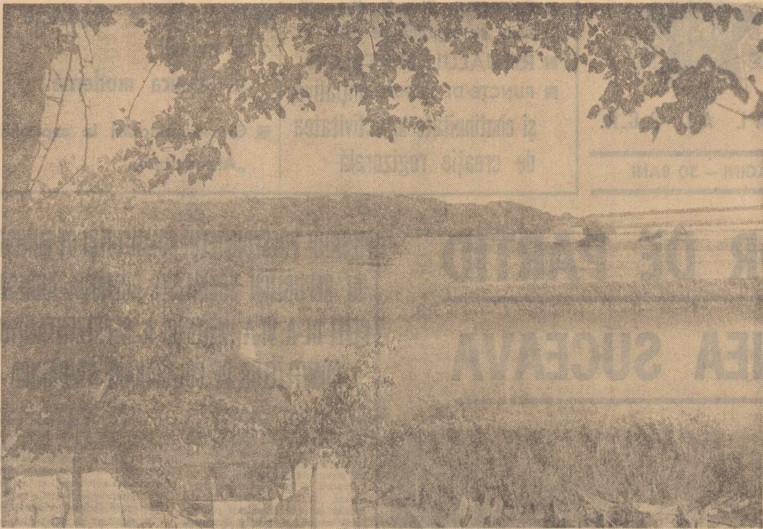
În Delta Dunării