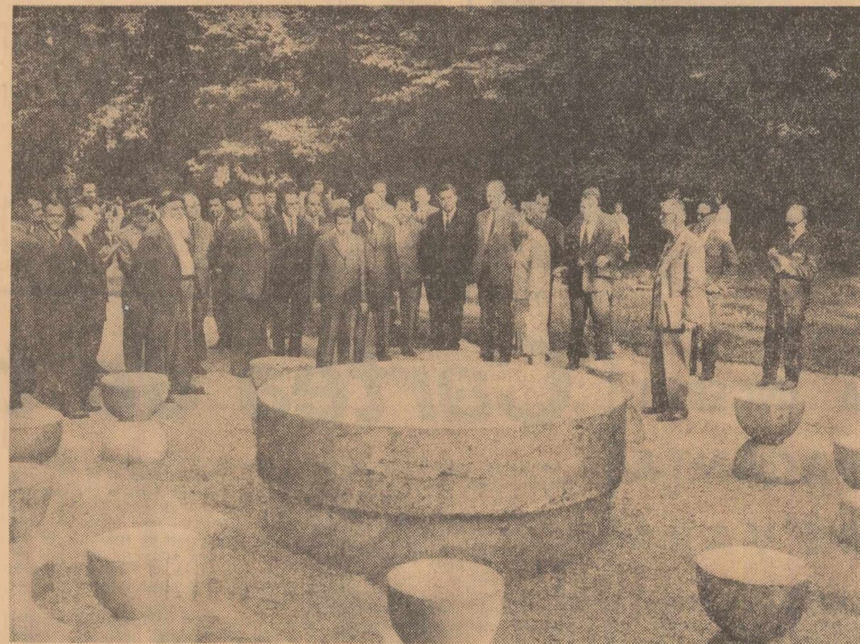
În parcul din Tg. Jiu: popas la Masa tăcerii, una din operele lui Brâncuşi

siderăm manifestarea de astăzi de la Padeş ca o sărbătoare a împlinirii a 145 de ani de la răscoală. Aceasta aniversare trebuie să se reflecte mai larg în presa noastră şi, în general, să i se dea cîntec pe care o merită această dată memorabilă în istoria luptelor poporului nostru pentru eliberarea socială şi naţională. S-ar cuveni ca monumentele de artă şi de cultură, care oglindesc tradiţiile revoluţionare să fie ceva mai bine îngrijite şi, mai cu seamă, mai bine puse în valoare. Un popor care are asemenea tradiţii democratice, revoluţionare, patriotice trebuie să ştie să le păstreze, să le cultive. Ele trebuie să constituie un mijloc de educare a tinerilor generaţii care, cunoscînd trecutul de luptă, ca şi prezentul, să înveţe cum să făurească mai bine viitorul pentru a crea condiţii de viaţă din ce în ce mai bune poporului nostru, pentru a asigura independenţa şi suveranitatea naţională, dezvoltarea naţiunii române ca naţiune egală în drepturi în rîndul naţiunilor socialiste, în rîndul naţiunilor întregii lumi.