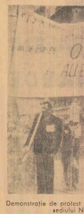
Demonstrație de protest la Bruxelles împotriva instalării sediului N.A.T.O. în Belgia

razbottului rece și intervenției militare în străinătate, care vor să înceteze învostrarea resurselor țării în cheltuieli militare...”. „În semn de protest împotriva politicii duse de guvernul Statelor Unite în Vietnam renunțăm la cetățenia americană”, a declarat sculptorul american William Christensen la o conferință de presă care a avut loc marți la Tokio. Sînt un om de cultură și încerc să contribuim prin activitatea mea la menținerea păcii în lume.