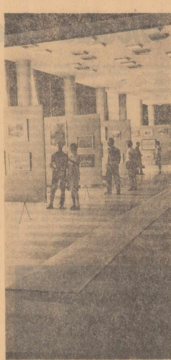
La Clubul Uzinelor Republica expun în aceste zile, din lucrările lor, elevii Școlii populare de artă din Capitală