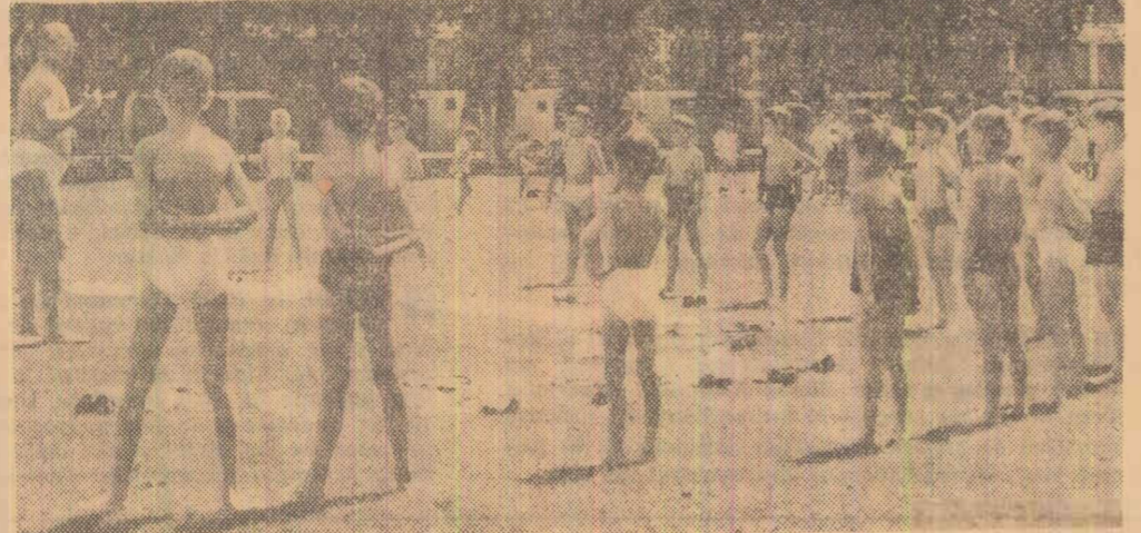
La vîrstă aceasta se învață și „a b c”-ul sportiv

În domeniul activității noastre nu există corijențe și nu se dau diplome de absolvire, de la categoria „copii” la „juniori”. Sportul de performanță implică însă spirit de răspundere și îndatorire la fel de importante ca în toate celelalte domenii ale vieții sociale.