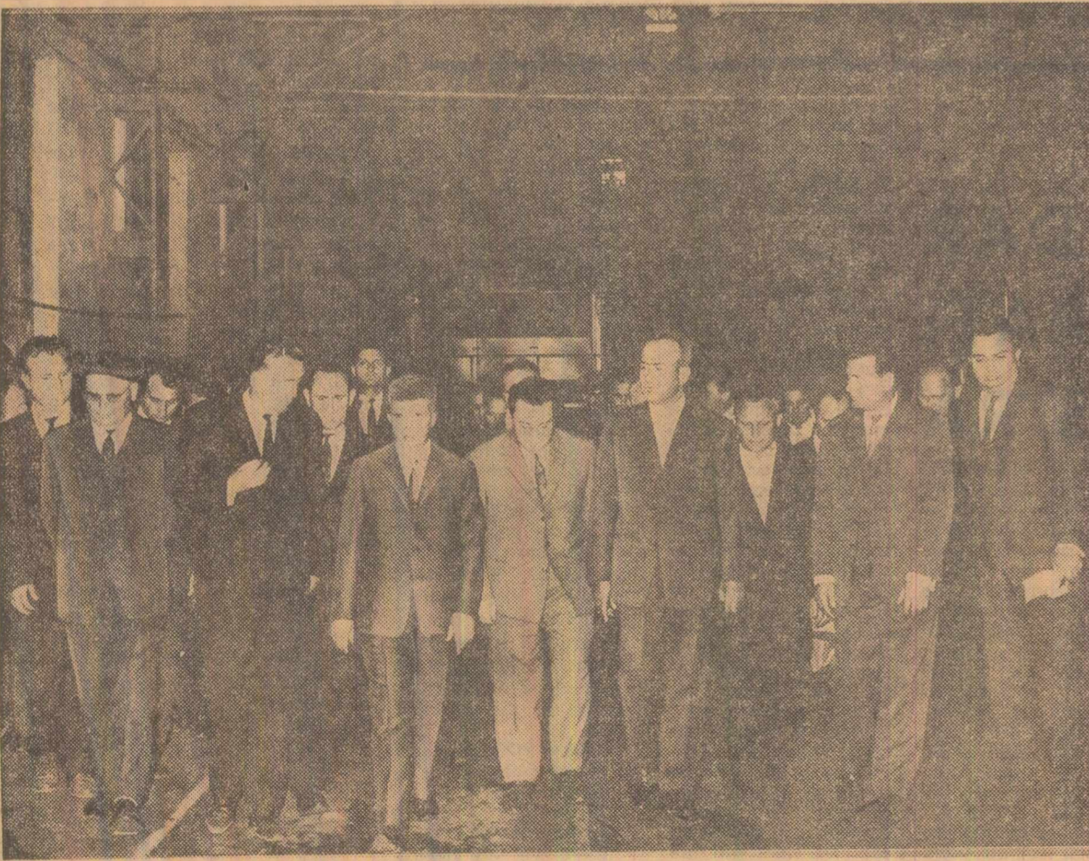
În vizită la Uzinele mecanice din Tr. Severin