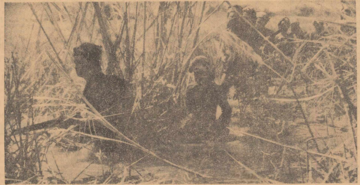
Forțele patriotice sud-vietnameze, luptînd cu eroism, sub conducerea Frontului Național de Eliberare, obțin în aceste zile noi victorii asupra intervențiștilor americani și marionetelor de la Saigon. În fotografie: O unitate a Armatei de Eliberare înaintînd prin junglă spre obiectivul militar inamic