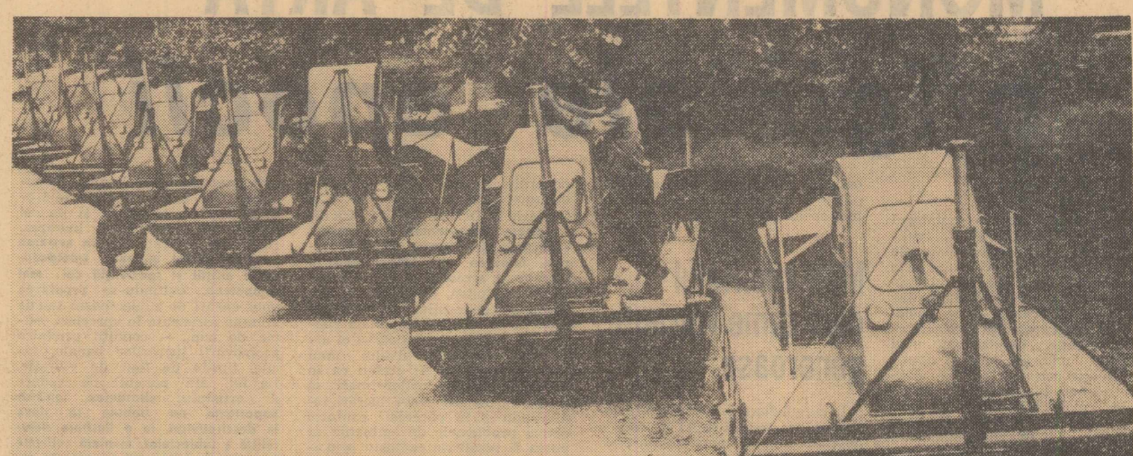
Întreprinderea metalurgică de utilaje din Medgidia: se face o ultimă verificare la un nou lot de tractoare destinate recoltării stufului, înainte de a fi expediate beneficiarilor.