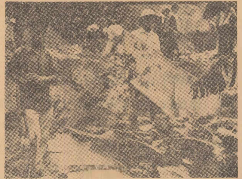
La 17 iunie, avioane de luptă americane au continuat să bombardeze teritoriul R. D. Vietnam. Forțele militare aeriene ale Armatei populare vietnameze au doborât în provincia Nghe An trei avioane. Numărul avioanelor americane doborâte deasupra teritoriului R. D. Vietnam se cifrează astfel la 1123. În fotografie: rămășițele unui avion doborât

SAIGON 17 (Agerpres). — Agenția V.N.A. relatează că o unitate a forțelor Frontului Național de Eliberare, care operează în regiunea septentrională a Vietnamului de sud, a doborât, recent, două elicoptere americane. Se menționează că ambele elicoptere au fost reparate și distruse de un tânăr patriot dintr-o unitate a F.N.E.