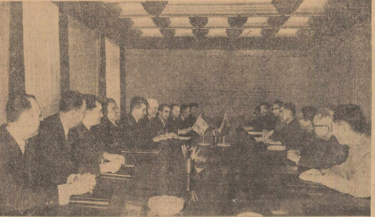
În timpul convorbirilor oficiale

Convoorbirile s-au desfășurat într-o atmosferă cordială, tovarășească.