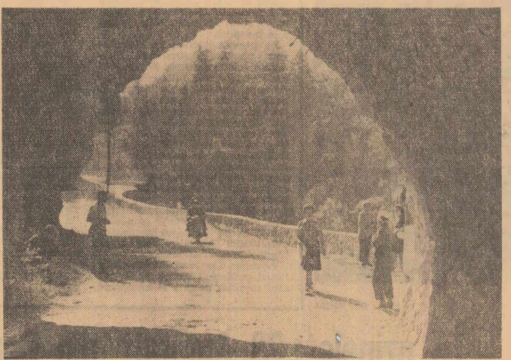
Spre Cheile Bicazului...

Pe Valea Someșului Mic, în raionul Gherla, portul sătenilor este puternic influențat de moda orășenească. Dar — ca o insulă — comuna Sic, cu o populație de aproximativ 6.000 de locuitori, face notă distinctă. Femeile poartă rochii roșii cu imprimeuri negre discrete, năframe negre cu margini roșii, iar bărba-