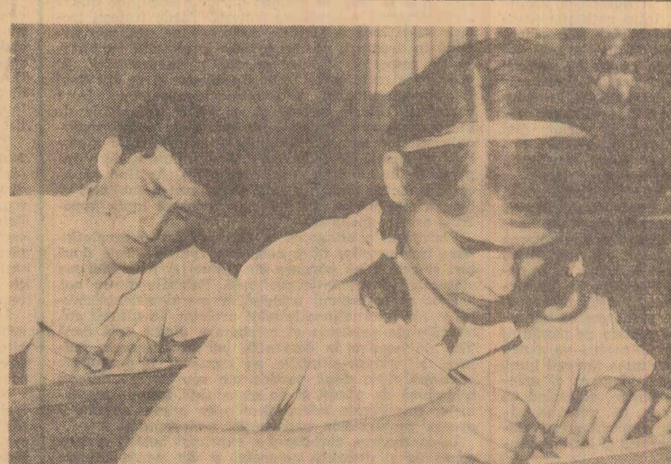
leri a început examenul de maturitate