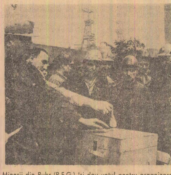
Minerii din Ruhr (R.F.G.) își dau votul pentru organizarea grevei ce urmează să fie declanșată la 23 iunie

ROMA. Un milion de muncitori metalurști italieni din întreprinderile particulare au declarat o grevă de trei zile, în semn de protest împotriva refuzului patronilor de a satisface revendicările cu privire la încheierea noilor contracte colective de muncă și sporirea salariilor.