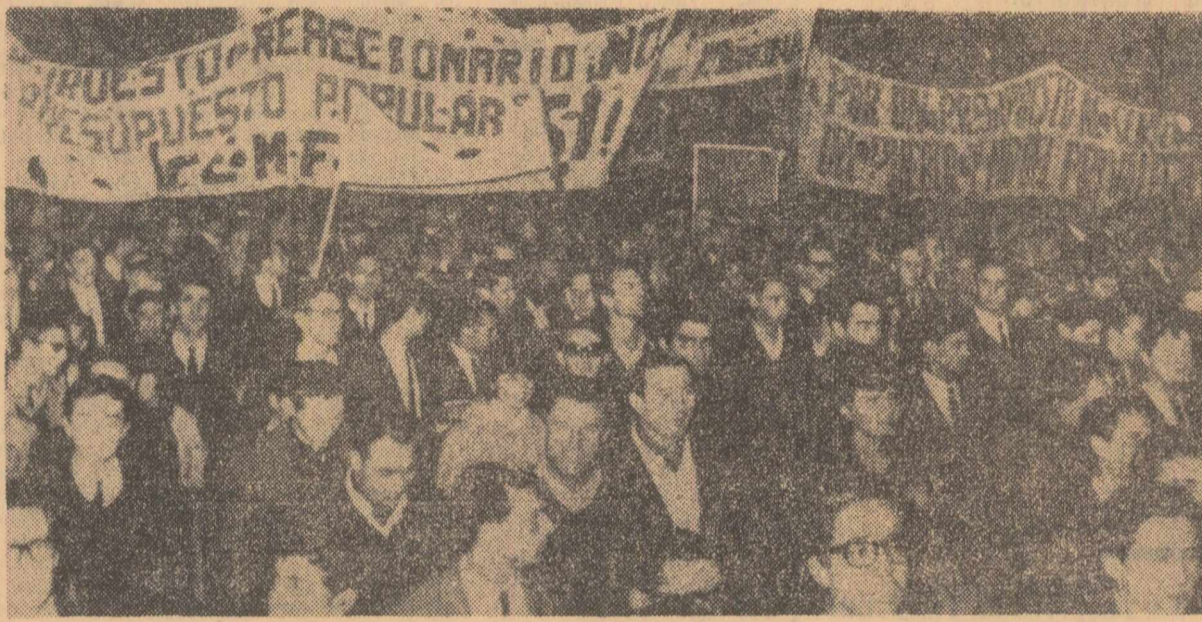
BUENOS AIRES: Studenții argentinieni manifestează în fața parlamentului pentru sporirea alocațiilor în domeniul învățămîntului

La ședința Comisiei de plan și bugetare, dr. Miklos Ajtai, președintele Comisiei de Stat a Planificării a R. P. Ungare, a arătat că, potrivit prevederilor, în perioada pînă la 1970 producția industrială va înregistra o creștere anuală de 6 la sută. Creșterea producției agricole va fi de 13—15 la sută, ceea ce reprezintă un ritm superior de dezvoltare față de perioada celui de-al doilea cincinal. Ca și pînă acum, a arătat vorbitorul, în repartizarea veniturilor naționale se va urmări ca acumulările să nu sporească în dauna nivelului de trai. Potrivit planului, consumul va crește cu 14—16 la sută.