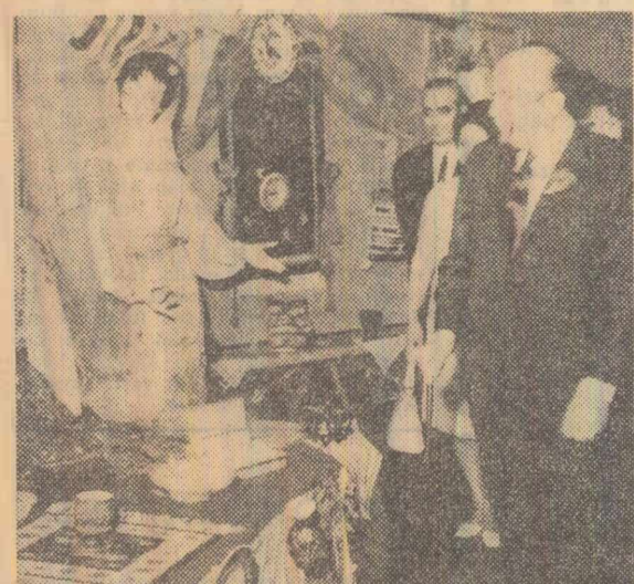
În aula facultății de arte frumoase a Universității din Teheran a fost deschisă expoziția „Peisaje din Republica Socialistă România”, inaugurată de premierul iranian Amir Abbas Hoveida (în fotografie)