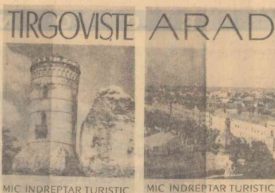
MIC INDREPTAR TURISTIC

Instantaneu la examenul de maturitate — probă orală la matematică