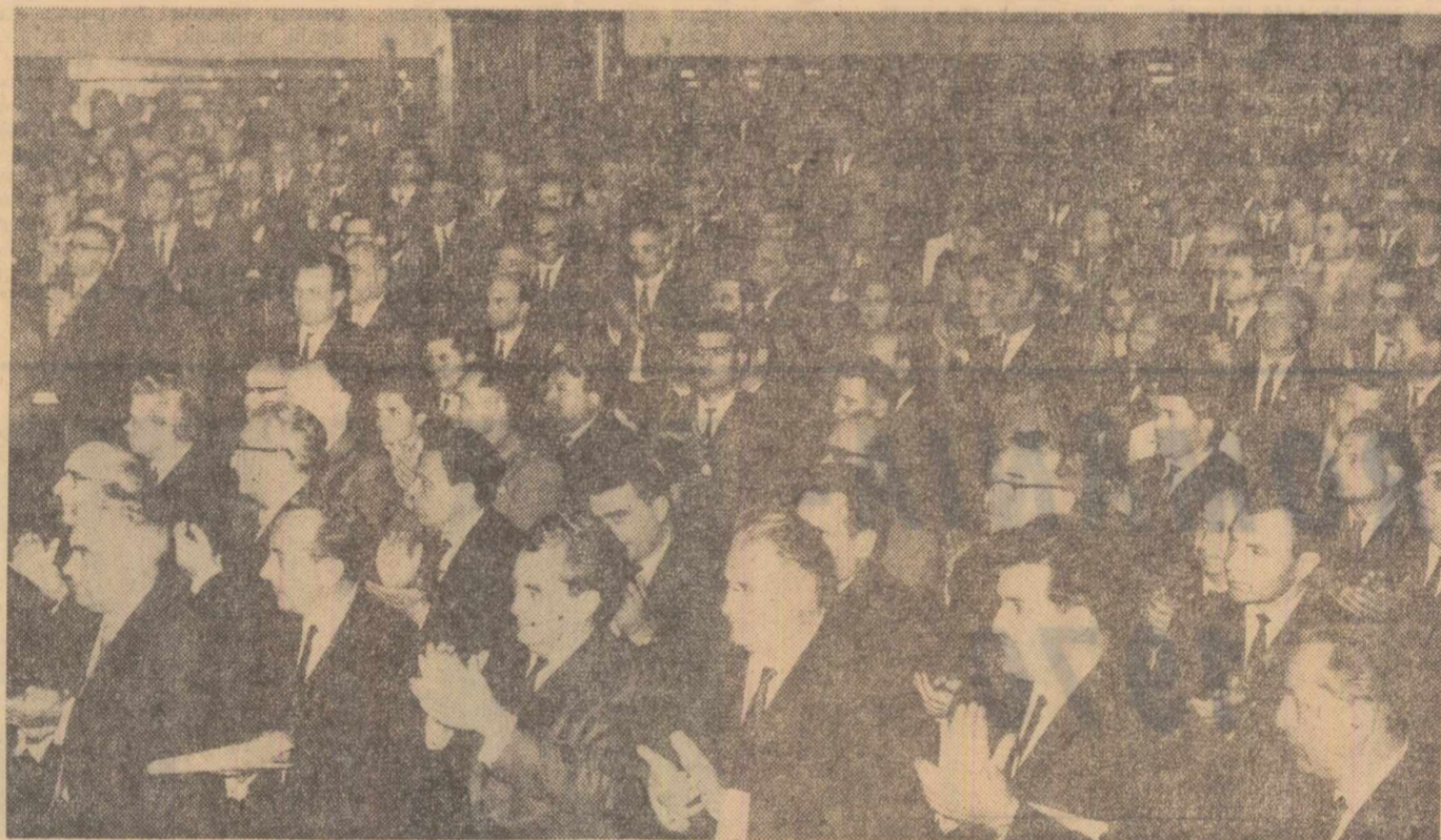
Aspect de la ședința de dimineață

În termocentralele regiunii sporește în continuare puterea instalată. În anul 1970 vor funcționa grupuri electrogene cu o putere totală de 1.100