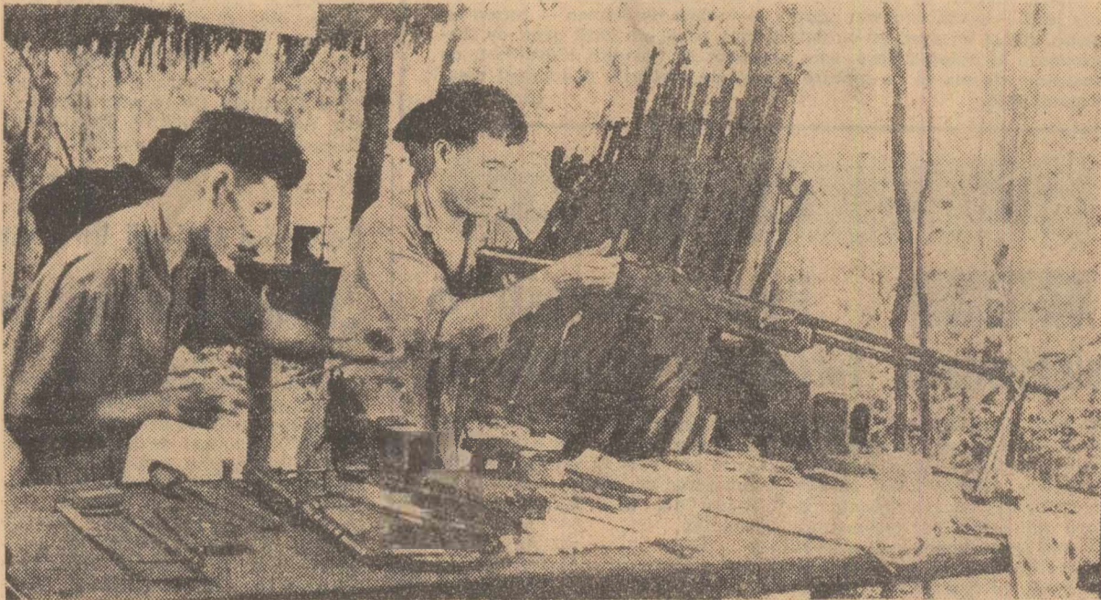
Cel mai bun furnizor de armament al forțelor patriotice din Vietnamul de sud sînt trupele americane și saigoneze. În fotografie: un centru al Frontului Național de Eliberare în care armamentul capturat este recuperat

NEW YORK 29 (Agerpres). — Într-un comunicat dat publicității la New York, secretarul general al O.N.U., U Thant, și-a exprimat „regretul profund în legătură cu bombardarea zonelor cu populație densă Haifong și Hanoi”. Secretarul general — arată comunicatul — și-a exprimat cu diferite prilejuri părerea că primul pas ce trebuie realizat în căutarea păcii în Vietnam trebuie să-l constituie încetarea bombardamentelor asupra Vietnamului de nord.”