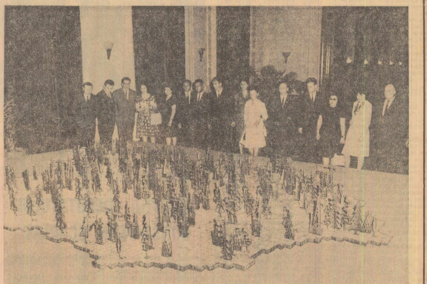
Imaginea de ansamblu a dezvoltării economiei naționale. Lumini ce se aprind succesiv indică locul marilor obiective ale cincinalului