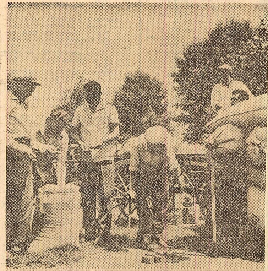
Primii saci cu gru din recolta acestui an la C.A.P. „Drumul lui Lenin” din comuna Cătnănești, raionul Urziceni

in pragul campaniei, combinele prelese de balotat, secerătoarele-legători, tractoarele sint gata pentru a incepe strinsul recoltei.