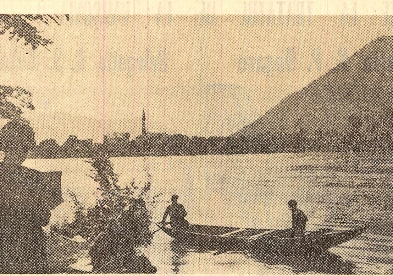
Încă o barcă alunecă pe Dunărea albastră către romantica Ada-Kaleh...