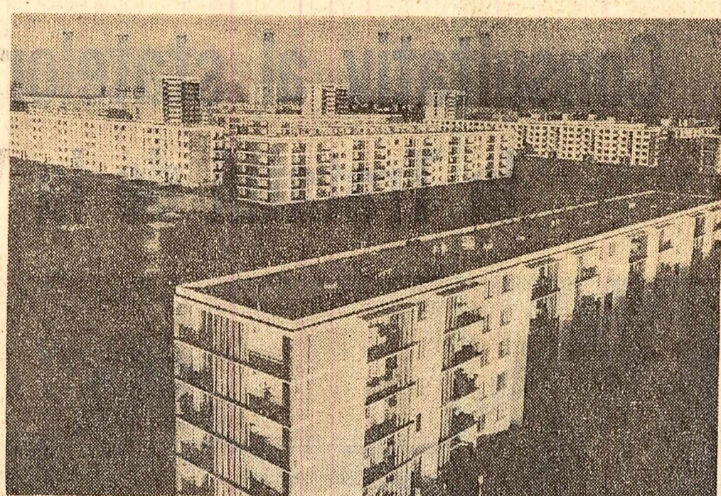
Carierul de locuințe Tiglina II din Galați