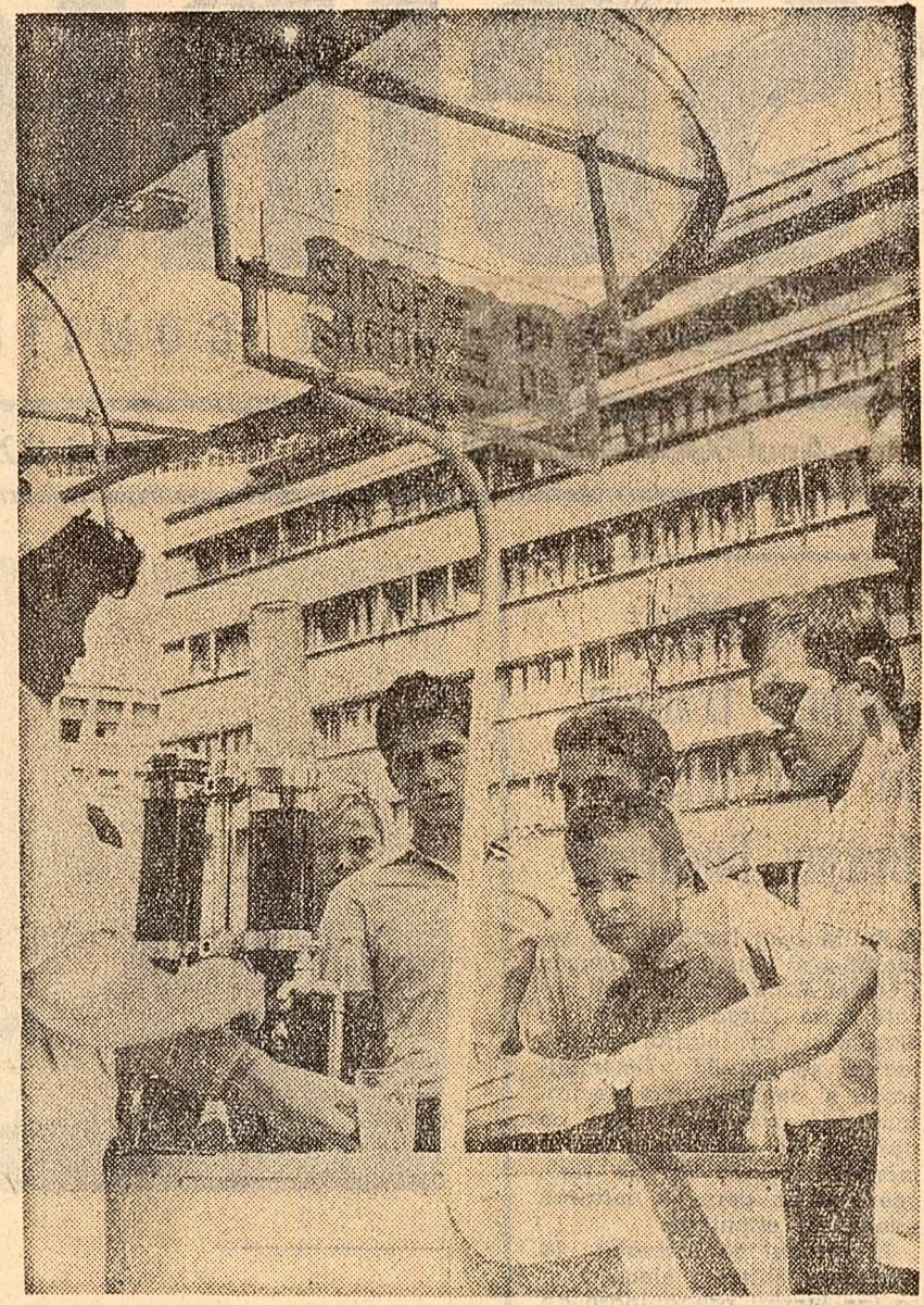
După cum se vede, săraci sortiment de răcoritoare! Ca și cum n-ar mai exista scurți, nectaruri și alte produse care să-ți poată asfințiri setea. Ca să nu mai spunem că unora sifonul cu sirop și se servește... cald