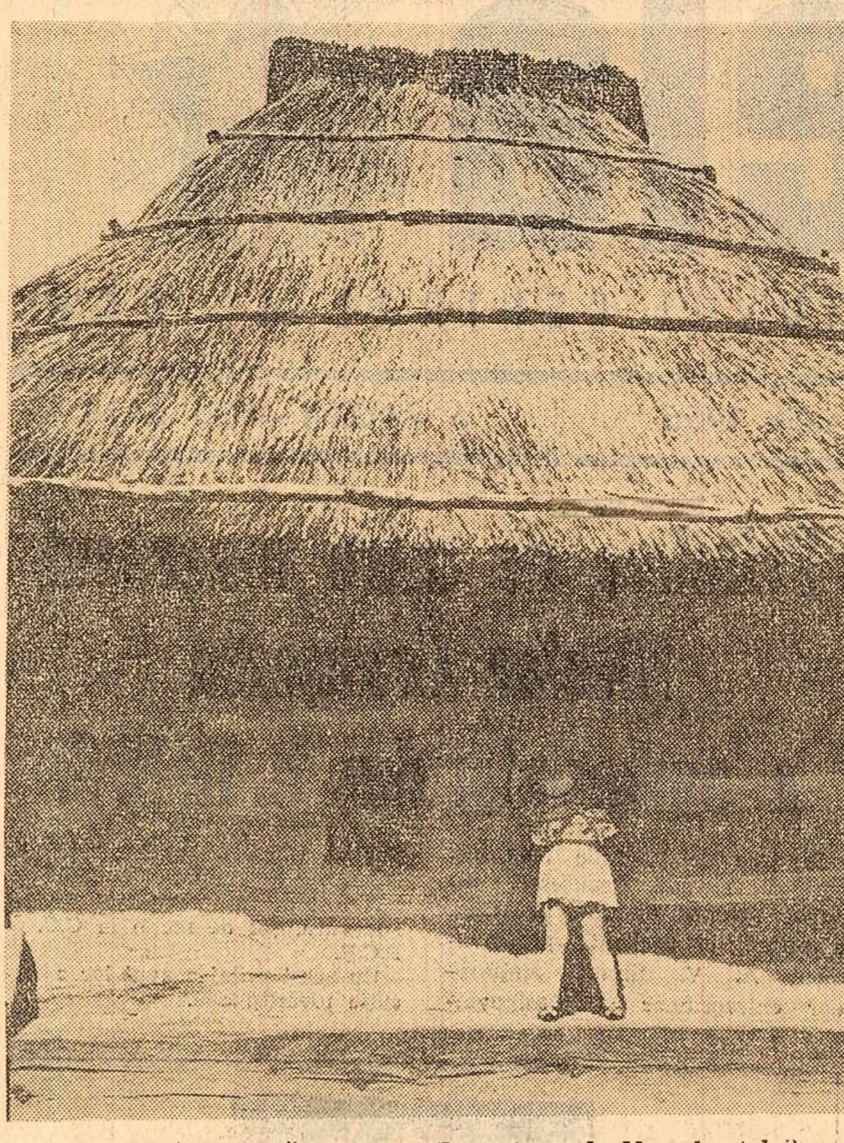
Parc ar fi căsuța din poveste... (Instantaneu la Muzeul satului)

cooperativei, a brigăzilor, neglijînd în schimb probleme majore privind întărirea democrației cooperative, munca politico-educativă de masă. Biroul comitetului regional a stabilit un sir de măsuri menite să contribuie la ridicarea nivelului muncii de partid în cooperativele agricole. Astfel, între altele, în acest trimestru, toate birourile comitetelor raionale de partid și-au prevăzut în plan analiza temeinică a tuturor laturilor activității unitii sau mai multor comitete de partid din cooperativele agricole. Dezvoltînd experiența dobîndită, vom asigura o îndrumare concretă, eficientă a comitetelor de partid din cooperativele agricole, cu convingerea că maturitatea, competența lor este o condiție de cea mai mare însemnătate a mobilizării maselor țărănimii cooperative la înfăptuirea sarcinilor trasate de Congresul al IX-lea al P.C.R. privind înflorirea agriculturii noastre socialiste.