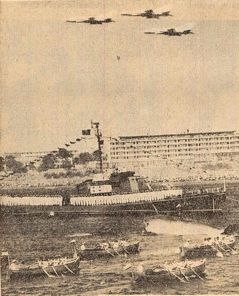
Ieri, la Mangalia