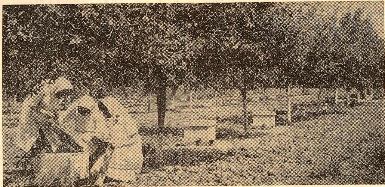
Stațiunea centrală de apicultură și sericultură. Cercetătorii verifică starea stupilor de albine