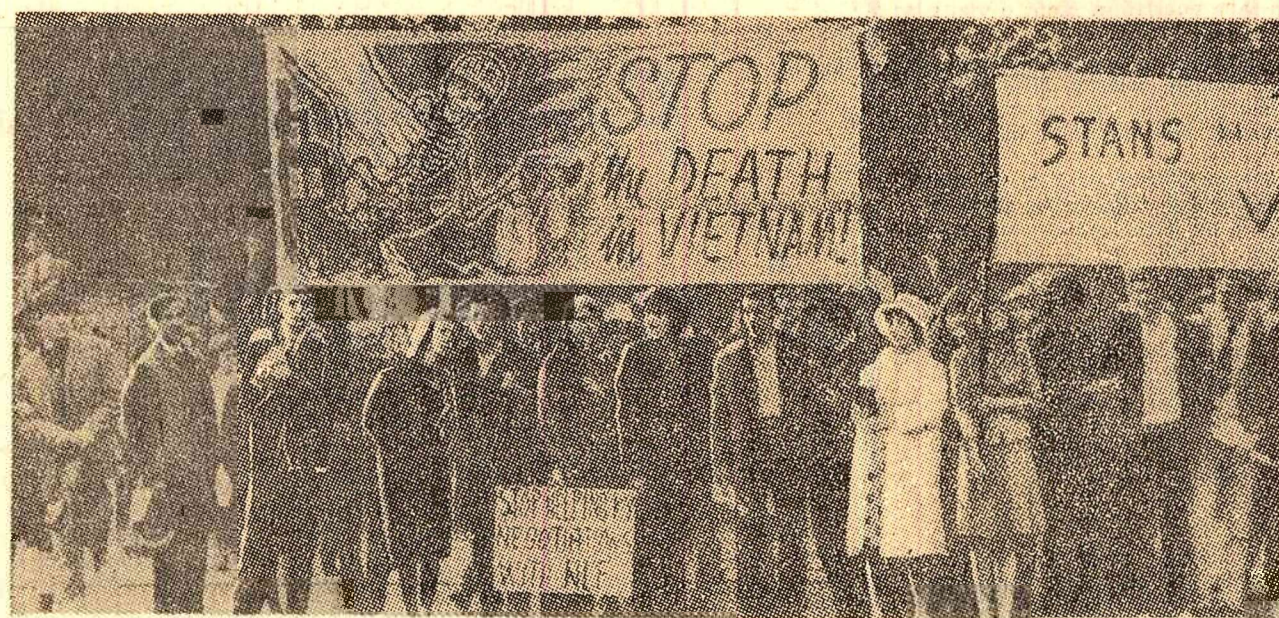
„Opriti moartea în Vietnam!” Cu aceste cuvinte l-a înțîmpinat populația din Oslo pe secretarul de stat Dean Rusk care a vizitat recent Norvegia