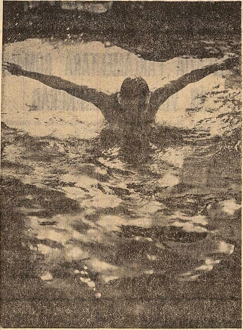
Zbor nautic...