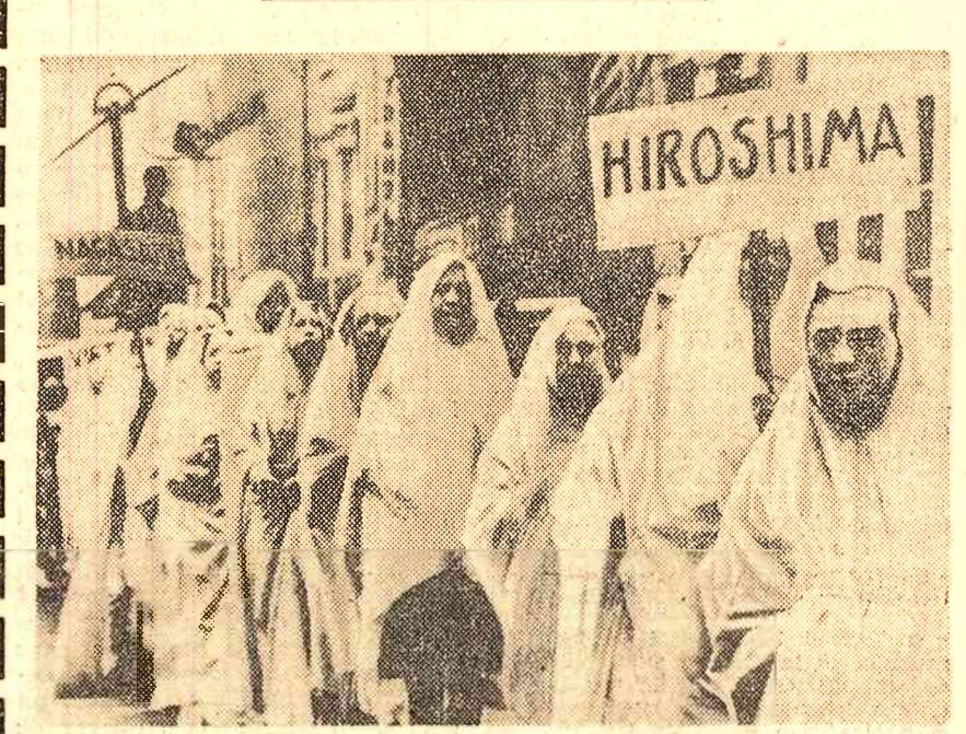
Cu prilejul împlinirii a 21 de ani de la bombardamentele atomice de la Hiroshima și Nagasaki, pe străzile multor orașe americane au avut loc demonstrații prin care participanții și-au manifestat ostilitatea față de politica agresivă a S.U.A. În fotografie: un grup de demonstrați infuzorji în giulgerii simbolice străbătând străzile Philadelphia