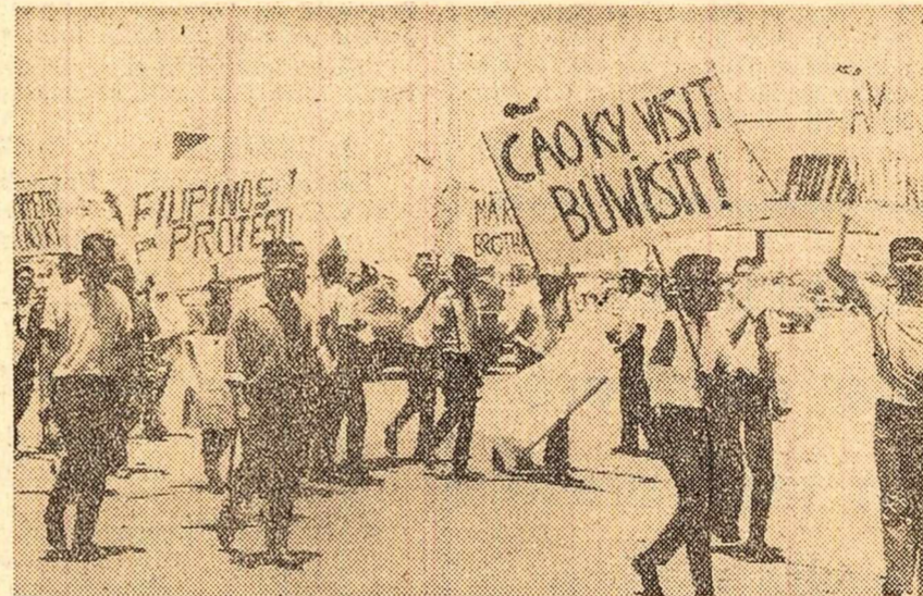
„Filipinezii protestează”, „Kao Ky cară-te ocașă!” — sub aceste lozinci, pe străzile orașului Manila a avut loc recent o demonstrație împotriva prezenței primului ministru al Vietnamului de sud...