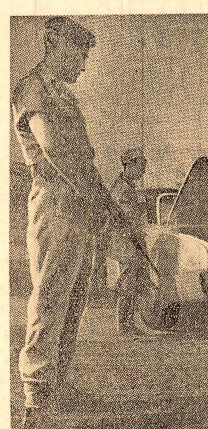
O imagine caracteristică a Adenului: principalele puncte de acces în oraș se află sub controlul sever al trupelor britanice. Mașini, cărute, oameni, totul este perchezionat cu minuțiozitate...