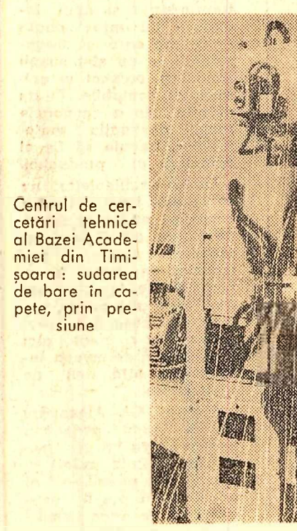
Centrul de cercetări tehnice al Bazei Academice din Timșoara: sudarea de bare în cope, prin presiune