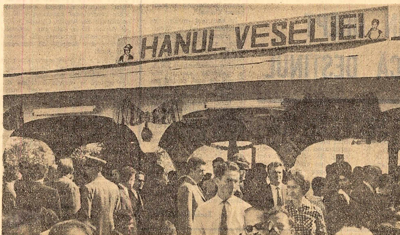
În centrul Piteștilor

Bogăția zilei, de la un capăt la altul al țării, este de necuprîns. Ecoul ei va continua zile și săptămîni de-a rîndul, în munca plină de voce bună a stringerii din vreme, fără vreo pierdere, a întregii noastre recolte — recolta de aur a țării.