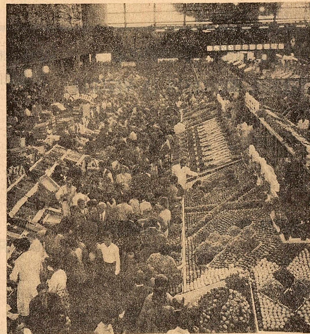
Piața Obor — un covor de culori și arome jesus cu mii de mîini