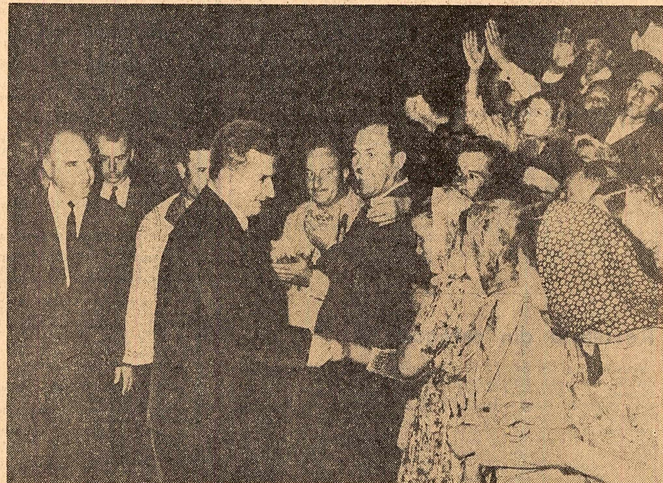
Primire entuziastă la Coșereni

miliarde lei. Ea dispune de un parc cuprînzînd 81 mii tractoare, 36 mii combine, numeroase alte mașini și utilaje, folosește cantități tot mai mari de îngrășăminte chimice, dispune de ajutorul a zeci de mii de ingineri și tehnicieni. Producțiile agricole medii la hectar au crescut an de an, a sporit producția de carne, ouă, lapte, brînzeturile livrate pe piață, cooperativele agricole s-au întărit, au sporit veniturile țărănilor cooperatori. În perioada 1960—1965 s-au construit la sate peste 600 000 case noi, numărul sălilor de clasă construite în aceeași perioadă s-a ridicat la peste 18 000, iar al satelor electrificate a depășit cifra de 7 600. Muncind mai cu spor, trînd mai bine, beneficiind tot mai mult de cuceririle civilizației socialiste, țărănimea noastră cooperatistă, aliata de nedejde a clasei muncitoare, poate raporta cu mîndrie partidului, în această zi, despre noile ei succese, despre avîntul cu care s-a angajat în lupta pentru traducerea în viață a sarcinilor cincinalului.