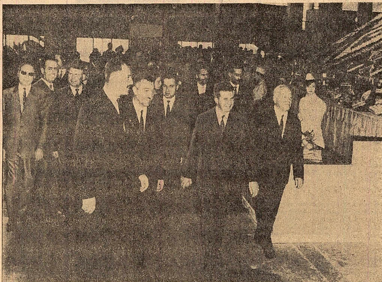
La Pavilion, standurile reconstituie dealurile cu livezi și vii

...Orele 9,30. Nouă tunicăreșe venite din Munții Apuseni, din comuna Avram Iancu, aduc Capitalăi salutului cristalin al Carpaților, vestind începutul acestei sărbători strămoșești și sosirea la sărbătoare a conducătorilor de partid și de stat. În aplauzele și uralele mulțimii, în fluturările de steaguri, buchete de flori, batiste colorate, din mașinile oprite în fața porții coboară tovarășii Nicolae Ceaușescu, Chivu Stoica, Gheorghe