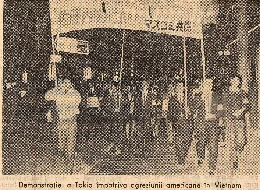
Demonstrație la Tokio împotriva agresiunii americane în Vietnam

Comitetul politic a adoptat, de asemenea, în ședința de ieri, o rezoluție inițiată de Pakistan în care se recomandă convocarea unei conferințe mondiale a țărilor care nu dețin arma nucleară.