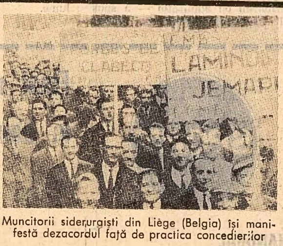
Muncitorii siderurgici din Liège (Belgia) își manifestă dezacordul față de practica concedierilor

(Agerpres). — Vineri, la ora 22.46 (ora Bucureștiului) a fost lansată de la Cape Kennedy nave cosmică americană „Gemini-12”, avînd la bord cosmonauții James Lovell și Edwin Aldrin. Nava s-a plasat pe orbită. Cu 30 de minute mai devreme, de la Cape Kennedy a fost lansată racheta-tintă „Agena” pe care cabina spațială „Gemini-12” urmează să o întâlnească pe o orbită în primele ore ale zborului său. Zborul de patru zile al acestei nave va marca încheierea programului spațial american „Gemini”.