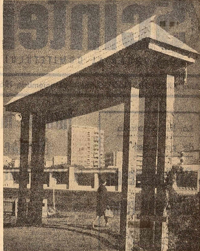
SUCEAVA. Noua arhitectură a cartierului Arin.

— Este absolut necesar ca între depunerile actelor pentru căsătorie și încheierea ei să se stabilească o perioadă de trei luni. Cele 9 zile, așa cum este situația în clipa de față, favorizează extinderea unui fenomen negativ. Este fel de utilă măsură reintroducerii martorilor la căsătorie, oamenii maturi, care să garanteze din punct de vedere moral stabilitatea viitoarei căsnicii.