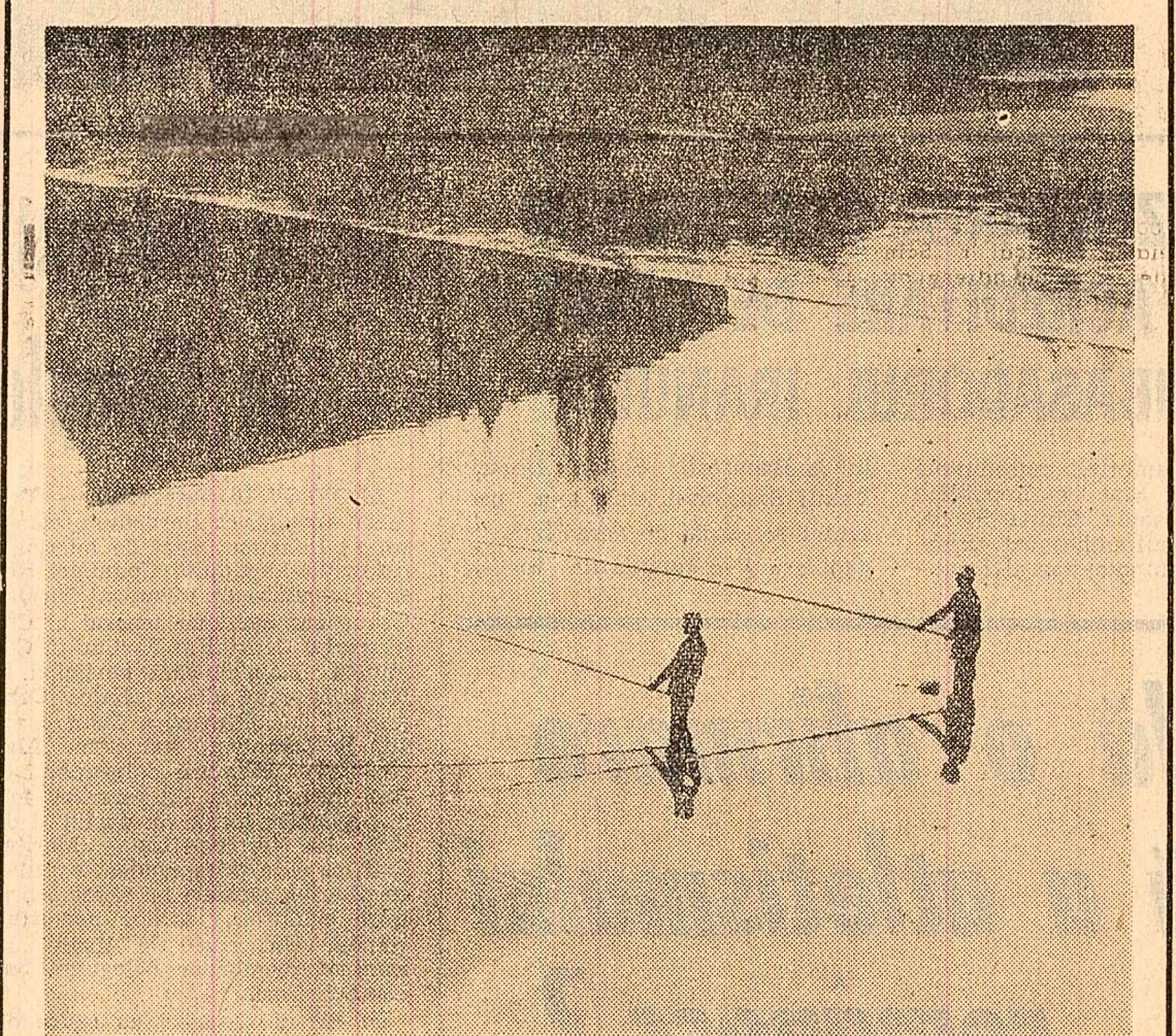
Pescuit de toamnă