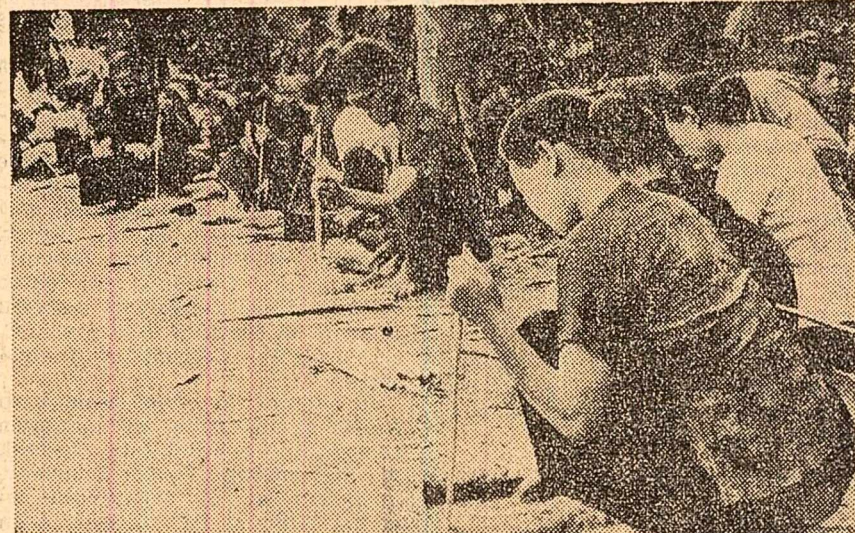
În Vietnamul de sud: se pregătesc tărșuși din lemn de bambus și palmier, care servesc la construirea capcanelor întinse de patrioți în calea intervenționiștilor americani și a unităților regimului de la Saigon

Din Saigon, agenția France Presse relatează că unitățile patrioților au continuat operațiunile de hărțuire împotriva forțelor militare americane, staționate în imediata apropiere a capitalei sud-vietnameze. O unitate a primei divizii de infanterie americană a fost bombardată cu mortiere, în mai multe rânduri. În provincia Tay Ninh, trei elicoptere americane, atinse de tirul armelor de foc ale patrioților, au aterizat forțat, iar altele două, în zona Da Nang, aparținând corpului de infanterie marină, au fost doborâte. Trei piloți au fost uciși.