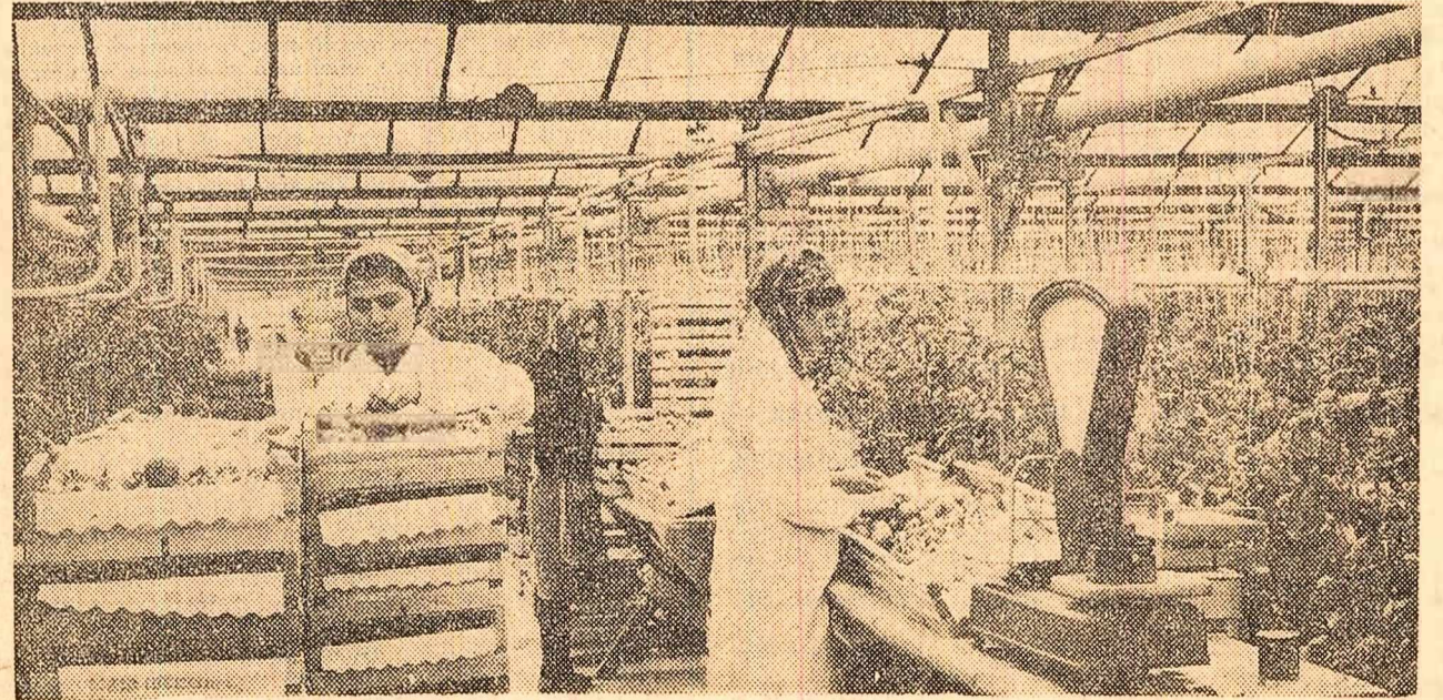
Stațiunea experimentală agricolă Șînnic-Craiova. Se sortează roșiile din noua recoltă