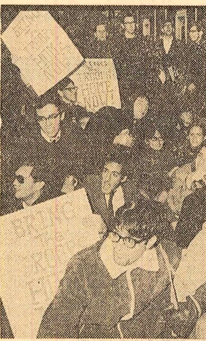
Cambridge (statul Massachusetts). Pichete de protest împotriva războiului din Vietnam...