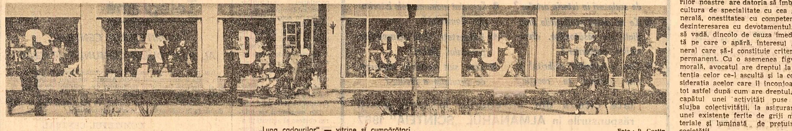
„Luna cadourilor” — vitrine și cumpărători

Iată, asadar, cum înțelegem să fie înălțate caracteristicele, figura morală a avocatului. Continuuînd și îmbogățind în condițiile noii noastre orînduiri tradițiile unor figuri strălucite de avocat devotați poporului, progresiști, care au ilustrat profesunea și s-au înscris ca patrioți în strădania lor pentru apărarea libertăților și drepturilor poporului român, avocatul vremurilor noastre are datoria să împlinească cultura de specialitate cu cea generală, onestitatea cu competența, dezinteresarea cu devotamentul, și să vadă, dincolo de cauza imediată pe care o apără, interesul general care să-l constituie criteriul permanent. Cu o asemenea figură morală, avocatul are dreptul la atenția celor ce-l ascultă și la considerația acestor care îl înconjoară, tot astfel după cum are dreptul, la capătul unei activități puse în slujba colectivității, la asigurarea unei existențe ferice de grijă materiale și luminată de prețuirea societății.