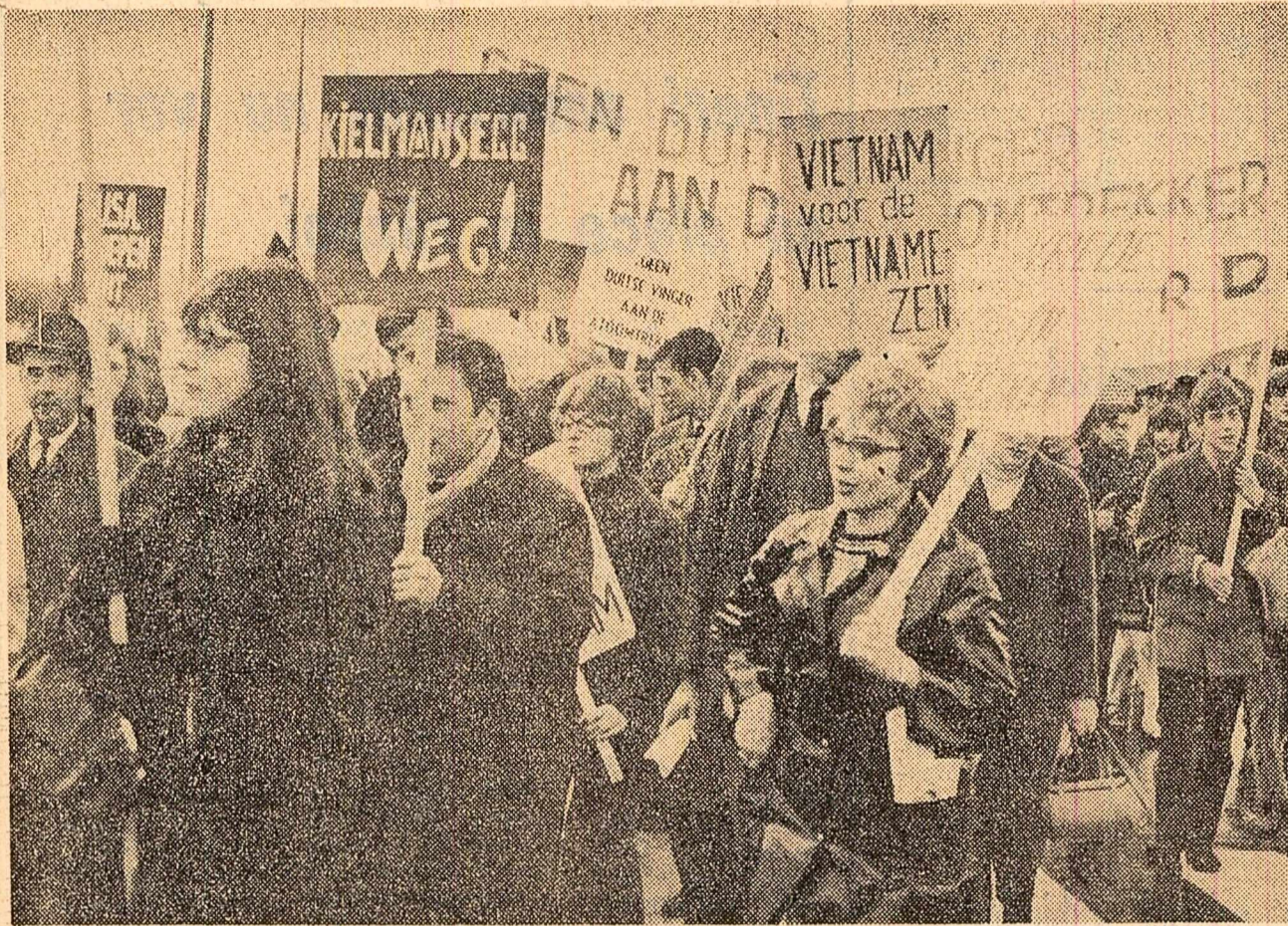
Amsterdam. Sute de olandezi au ieșit în stradă pentru a-și exprima indignarea față de bombardamentele barbare ale Statelor Unite împotriva R. D. Vietnam