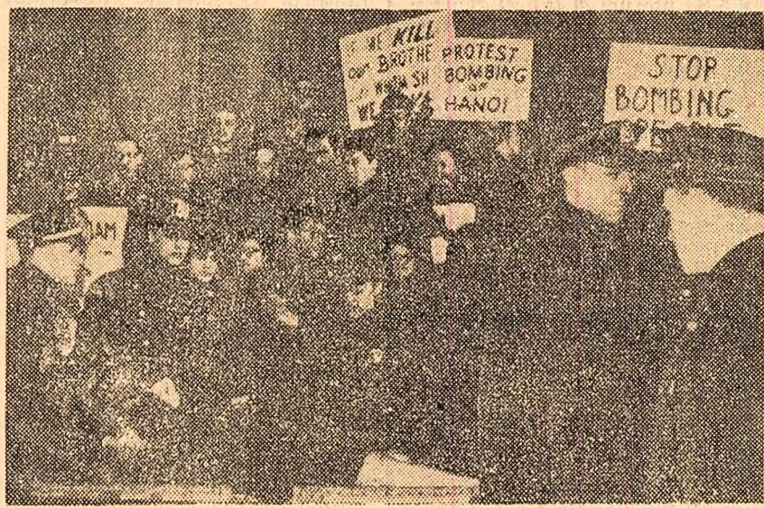
În fața centrului de recrutare din New York a avut loc o manifestație împotriva războiului dus de S.U.A. în Vietnam. Participanții la demonstrație poartă pancarte pe care scrie „Protestăm împotriva bombardării Hanoiului”, „Opriti bombardamentele”. În prim plan, poliștii încercând să împrăștie manifestația, evocăuză cu forța o femeie

HANOI 16 (Agerpres). — Președintele R. D. Vietnam, Ho Și Min, a adresat forțelor armate și populației din Hanoi o scrisoare prin care le felicită pentru victoriile repute în ultimele zile asupra forțelor aeriene ale S.U.A. și pentru doborârii celui de-al 1600-lea avion american. În numele Comitetului Central al partidului și al guvernului, se arată în scrisoare, felicitată armata, populația și cadrele de conducere din Hanoi pentru hotărârea lor de a lupta și a învinge. Forțele noastre armate și poporul nostru trebuie să-și mențină necontenit vigilența la un înalt nivel, să obțină cât mai multe victorii în luptă și în producție.