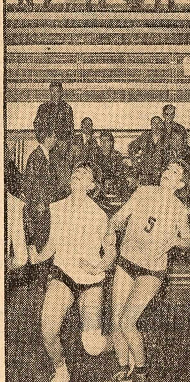
„Urmărire” sub panou

(Fază din meciul Constructorul—Voința București. Rezultatele meciurilor din campionatul feminin de baschet — în pag. a III-a)