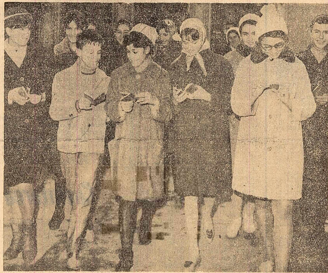
În fața Casei de cultură a tineretului din raionul 23 August, cîțiva dintre cei mai proaspeți posesori ai buletinului de identitate.

București. Firește, rădăcinioasele predomină. E vremea lor. S-au vîndut ieri, pînă la ora 11, peste 16 vagoane de cartofi, circa 8.000 kg de zarzavaturi, 14.000 kg de ceapă. În ciuda anotimpului se mai oferă încă varză și salată verde. A crescut cereșera la conserve: 11.000 de borcane în cîteva ore. Și la fructe s-au vîndut cantități considerabile: 32.000 kg de mere, 10.000 kg de pere, nuci și struguri. De cîteva zile s-au pus în vînzare brazii. Ieri, în piața Obor existau 5.000 de bucați. Dar, deși nu erau mai mult de o sută de cumpărători, în același timp, nu s-au putut înțelege asupra ordinii în care să-și aleagă fiecare un brad, astfel că au năvălit cu toții deodată. E limpede că îmbulzeala nu-și avea nici un rost.