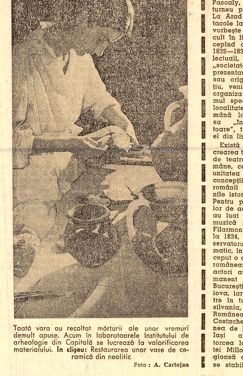
Toată vara au recolat măturile ale unor vremuri demult apuse. Acum în laboratoarele Institutului de arheologie din Capitală se lucrează la valorificarea materialului. În clipș: Restaurarea unor vase de ceramică din neolitic.