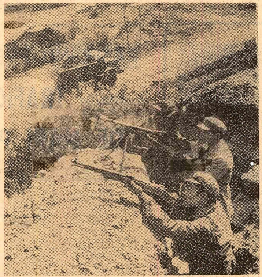
Viteji in muncă și in luptă. Muncitorii dintr-o zonă minieră a R. D. Vietnam, pe poziții de luptă, in timpul unei incursiuni aeriene dușmane

lare in bătălia petrolului, dar și să asigure o legătură permanentă cu organizațiile populare convinse de necesitatea de a reda poporului bogățiile sale petrolifere”. Din surse oficiale se precizează că membrii „Comitetului superior al petrolului” au elaborat un plan de acțiune.