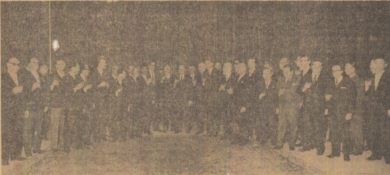
În timpul primirii la Consiliul de Stat