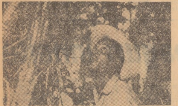
Coubite, film al regizorului cubanez Tomaz Guce. Alea. Este o frescă a vieții dintr-o mică localitate lângă Haiti, unde, cu ani în urmă, oamenii au mizeria și greutate.