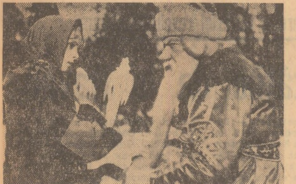
Moș Gerilă — producție a studioului „Maxim Gorki”, în regia lui Aleksandr Rou. A fost distins cu Marele Premiu Leul San Marco la Veneția — 1965, pentru cel mai bun film pentru copii.