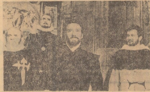
El Greco — coproducție a studiourilor italo-franceze. Filmul reînvia epoca zburcumată a inchiziției, evocând totodată viața și activitatea celebrului pictor grec Dominic Theotokopoulos, numit de către spanioli El Greco. Regizor: Luciano Salce.