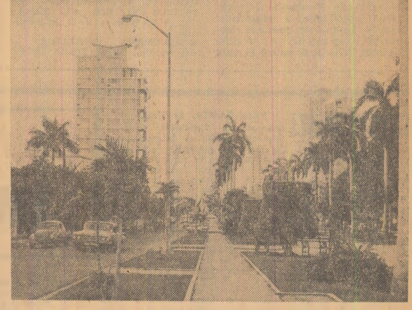
Vedere din capitala cubană, Havana