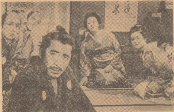
Sanjuro — o producție a studiourilor japoneze, în regia lui Akira Kurosawa. Acțiunea filmului se petrece înaintea războiului de restaurație din Japonia.