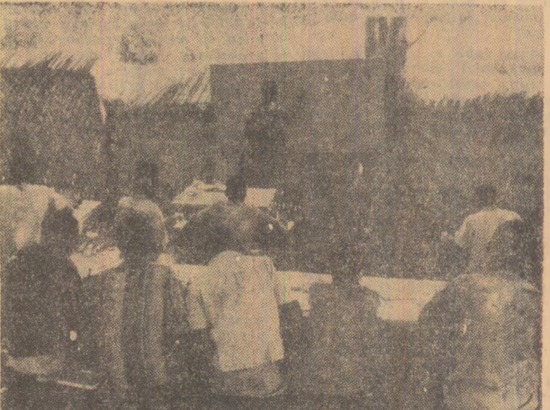
Mali. Viitori agronomi urmând expunerile lectorului la un curs de instruire din localitatea N'Tonimba

venții, alunecă treptat spre faliment, în timp ce marile firme particulare, îndeosebi străine, conviețuiesc de minune cu inflația și cu devalorizarea monedei. Poate că singura deosebire constă într-o accentuare a tensiunii ce umare a măsurilor foarte întreprinse împotriva manifestațiilor antigovernamentale, mergându-se până la ocuparea universităților de către armată. „Broasca și-a blin-