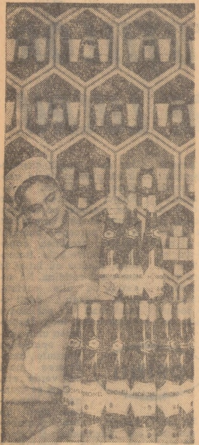
Hidromelul, un produs alcoolizat obținut din miere de albine cu un bogat conținut de vitamine