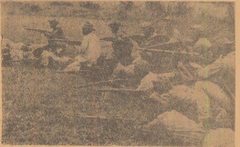
O unitate a forțelor patriotice din Angola care luptă pentru alungarea colonialiștilor portughezi, pentru independența țării

ferite cereri de credit. Dar, costul acestuia fiind ridicat — în urma sporirii ratei scontului în mai anul trecut, de la 4 la 5 la sută — întreprinderile mici și mijlocii s-au vădit puși în fața unor dificultăți în investiții. (De altfel, este îndoieinc dacă scderea cu o jumătate de procent a taxei de scont va constitui o soluție pentru acestea). Ce se urmărește, atunci, prin recenta măsură? O reacție în lanț, adică „ieftinirea creditului” în celelalte țări occidentale, în special în S.U.A. și Anglia, unde prețul acestuia este ridicat. Se apreciază că acest efect „psihologic” al măsurii luate la Frankfurt ar putea influența pozitiv comerțul exterior vest-german. Gh. C.