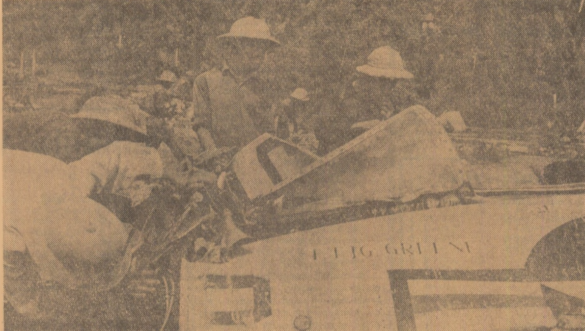
Armata și populația R. D. Vietnam luptă cu eroism împotriva piraților americani ai aerului care bombardează teritoriul țării. În fotografie: rămășițele unui avion doborât

subliniază că, în ciuda măsurilor severe de securitate luate de comandamentul trupelor americane și saigoneze, forțele patriotice au distrus numeroase avioane și elicoptere aflate la aeroport și câmpurile situate în apropierea acestuia. În cursul nopții, forțele patriotice au bombardat un post guvernamental situat în partea de est a aerodromului. Totodată, trei elicoptere americane au fost doborâte de patrioții sud-vietnamezi în apropierea de Saigon, în provincia Deilung Nam (Danang). Pe de altă parte, avioane americane au bombardat sectoare ale provinciei Dinh Duong, la 46 km depărtare de Saigon. Sursele americane au recunoscut că atacurile lansate în ultimele două zile de unitățile Frontului Național de Eliberare au provocat pierderi grele trupelor americano-saigoneze. În același timp, la Saigon a sosit generalul Earle Wheeler, șeful statului major al forțelor armate americane, pentru o vizită de o săptămână în Vietnamul de sud.