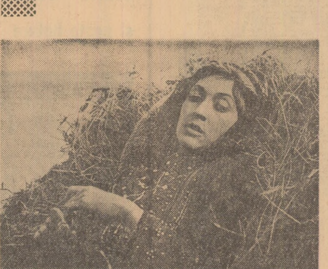
Balada din Hevsursk — producție U.R.S.S. (studioul „Gruzia-film”).