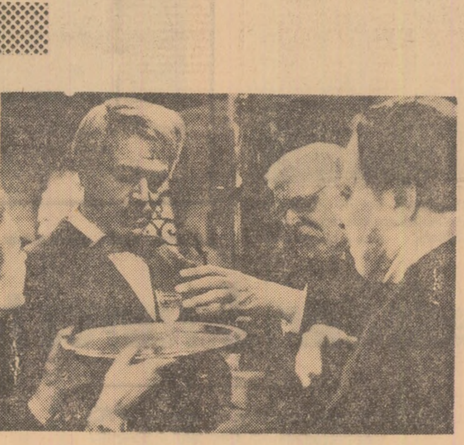
Cartea de la San Michele — coproducție R.F. Germană, Italia, Franța...