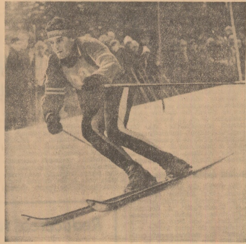
Pe pirtia Clăbucet, în timpul probei de slalom special