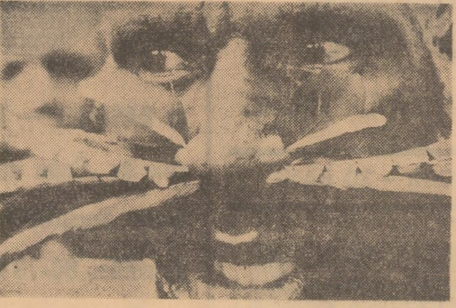
Mondo Cane — producție italiană în culori. Este un documentar de lung metraj...