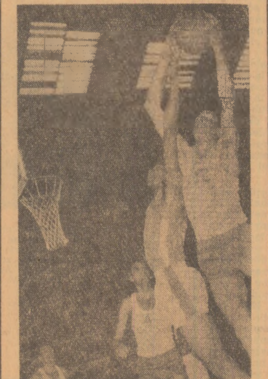
Fază din meciul de baschet Dinamo București—Royal IV Bruxelles.

● BASCHET — Debut victorios în „Cupa cupelor”: Dinamo București — Royal IV Bruxelles 86-70 ● HANDBAL — Popas în drum spre „mondiale” (Corespondență din Rheinhausen) ● CAMPIONATE — COMPETIȚII, în țară și peste hotare