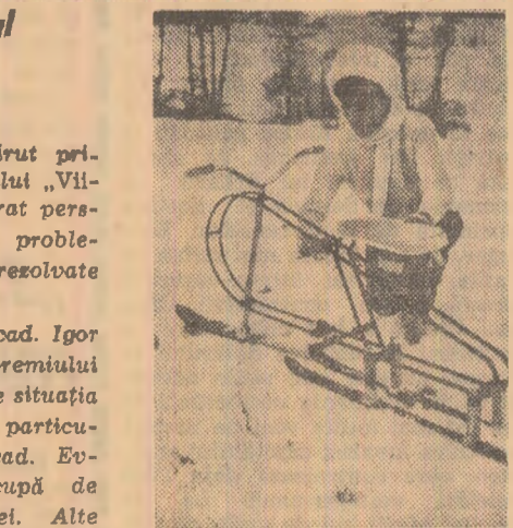
Această bicicletă pe schiuri construită la o fabrică din Bydgoszcz (R. P. Polonă) poate atinge o viteză de 70 km pe oră

Cititorii sînt conduși de autorii articolelor într-un laborator lunar și într-o uzină metalurgică a vitorului, cu noulă perspectivă radiocomunicațiilor prin Cosmos. La noua publicație își dau concursul și o serie de personalități marcante ale vieții științifice din străinătate.