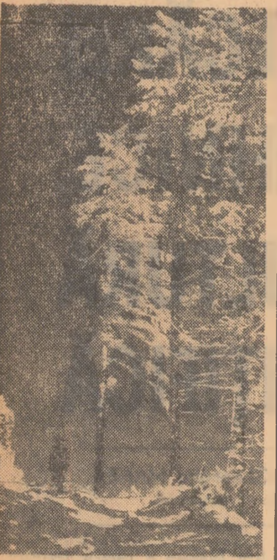
Brazi — soare — zăpadă