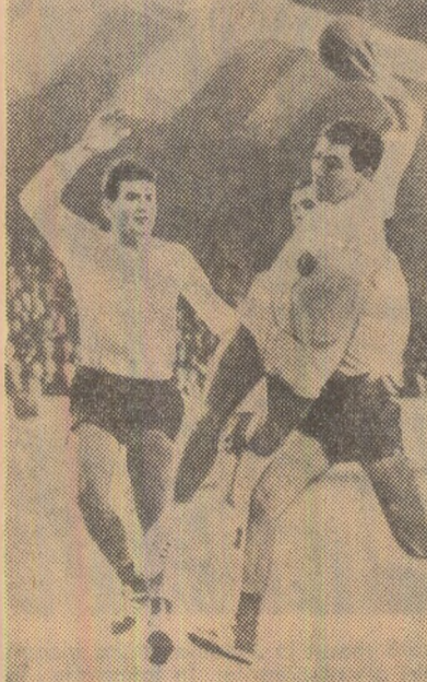
Fază din meciul România — R. D. Germană.