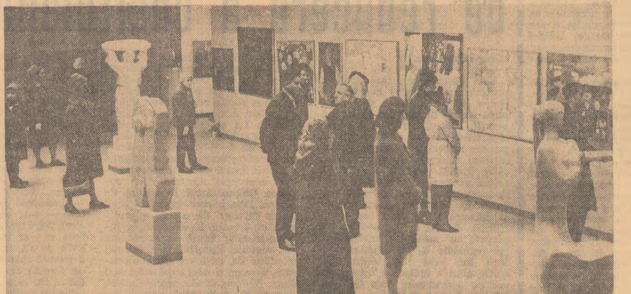
La Expoziția bională de pictură și sculptură din sala Dalles

Obiectele de artă decorativă sînt menite a intra tot mai mult în viața cotidiană. Pentru aceasta, pe lângă mentalitatea publicului, mai trebuie schimbată, în bună măsură, chiar mentalitatea unor artiști. Dacă s-au realizat și vor mai fi încă realizate unicate de valoare,