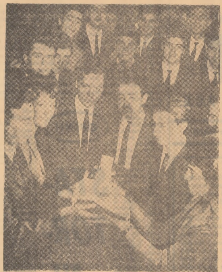
Un eveniment deosebit la Institutul de Construcții București: studenții anulului V au făcut din mașini și utilaje pentru construcții, care au terminat cursurile, predau ștafeta (un buldozer în miniatură, simbol al profesiunii) colegilor lor din anul IV.