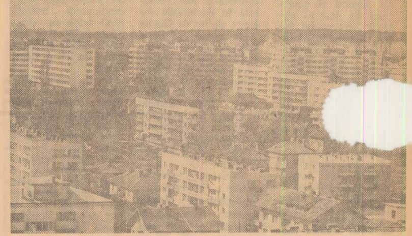
Noul complex de locuințe „Vostok” din Sofia