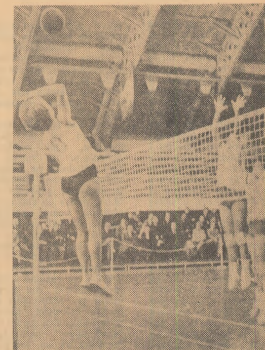
Un atac al rapidistelor în meciul amical cu selecționații Mexicului