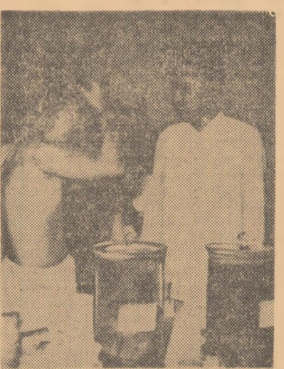
HANOI. Victime ale agresiunii americane examinate de membrii Comisiei de anchetă a Tribunalului Internațional Bertrand Russell.

HANOI 15 (Agerpres). — Membrii Comisiei de anchetă a Tribunalului Internațional Bertrand Russell, aflați într-o vizită în R.D. Vietnam, au ținut la Hanoi o conferință de presă în care au subliniat că „americaniile duc un război de agresiune împotriva Vietnamului cu mijloace și prin metode interzise de dreptul internațional”.