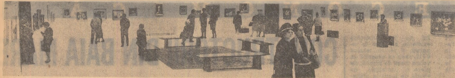
Admirind „florile” lui Luchian