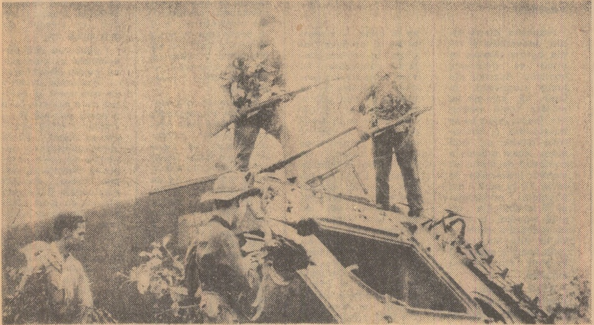
Patrioții sud-vietnamezi provoacă zilnic mari pierderi inamicului. În fotografie: un tanc american capturat de o unitate a Frontului Național de Eliberare