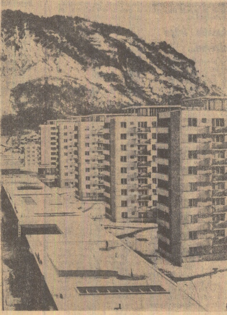
Din nou geometria a orașului Piatra Neamț