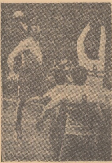
Grupa sînteză peste blocajul advers, în meciul cu Ungaria