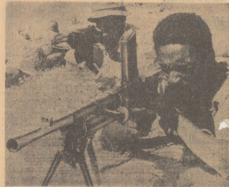
În Angola unități ale mișcării de eliberare luptă cu îndrăgine împotriva colonialiștilor portughezi

În scopul verificării noulor forme de conducere și de perfecționare a metodelor de gospodărie în cadrul ramurilor industriale, hotărârea recomandă experimentarea lor mai departe, o atenție deosebită acordându-se limitării în continuare a sferii indicatorilor cu caracter directiv și înlocuirii acestora cu alte pîrgiți economice și stimulente ale contresărilor materiale.