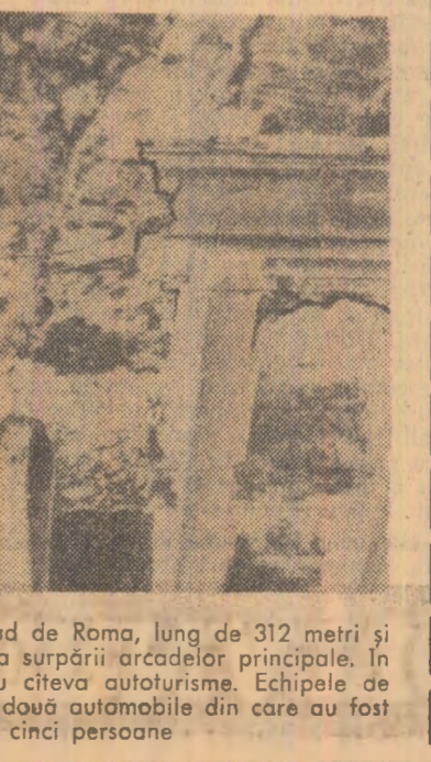
Podul Ariccia situat la 27 kilometri sud de Roma, lung de 312 metri și înalt de 60 metri, s-a prăbușit în urma spărării arcazelor principale...