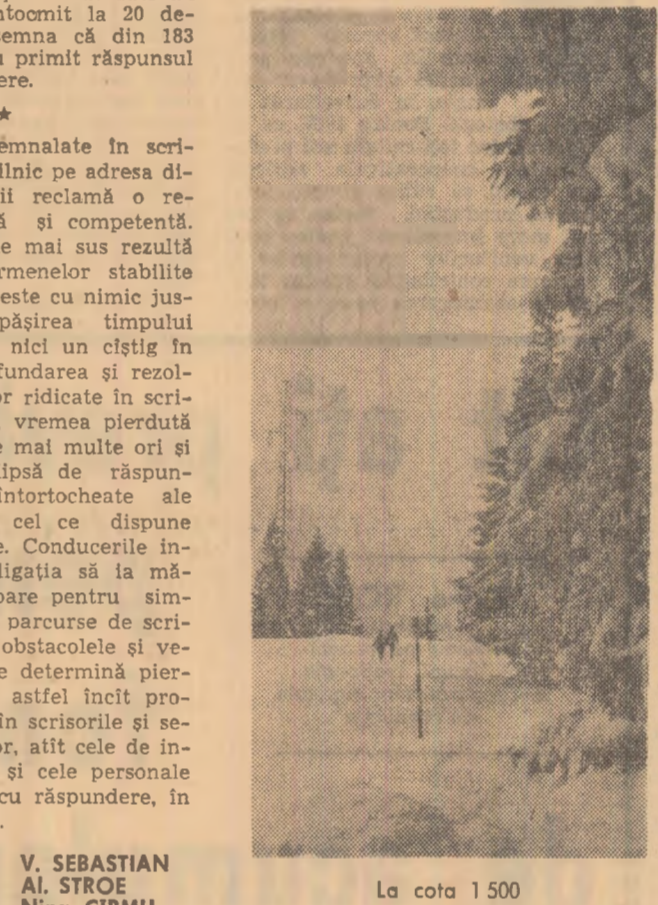
La cota 1.500 V. SEBASTIAN, A.I. STROE, Nina CIRMU

Pe „arterele” postale ale țării se încrucisează zilnic milioane de scrisori, felicitări, telegramme, pachete de diferite greutăți.