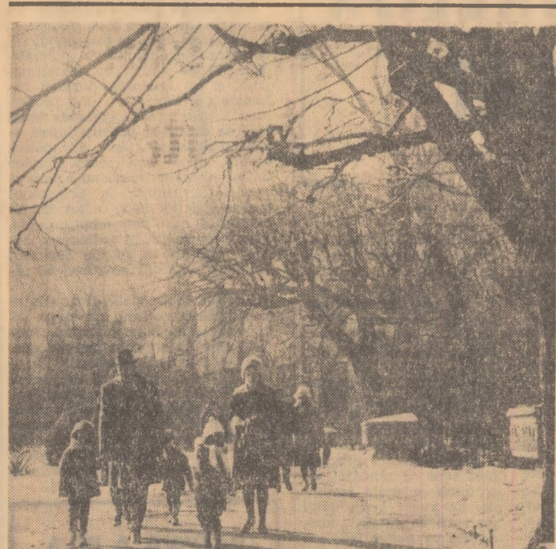
În stîrșii, e soare și e frumos. Nu e frig Pronosticul meteorologic pentru luna ianuarie... Începe să se odăverescă

„Dragă nea Costică...” (Scrisoare închisă adresată unchiului Costică, portar principal la Combinatul siderurgic Hunedoara)foileton de Nicuță TĂNASE