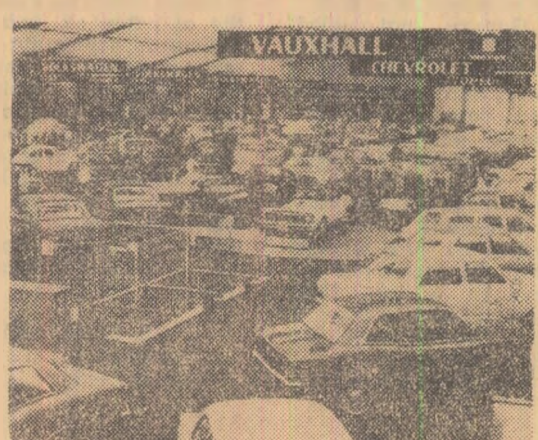
Aspect de la cel de-al 48-lea Salon automobilelor deschis recent la Bruxelles

BEIRUT. René Maheu, director general al UNESCO, a sosit duminică la Beirut într-o vizită oficială de o săptămînă.