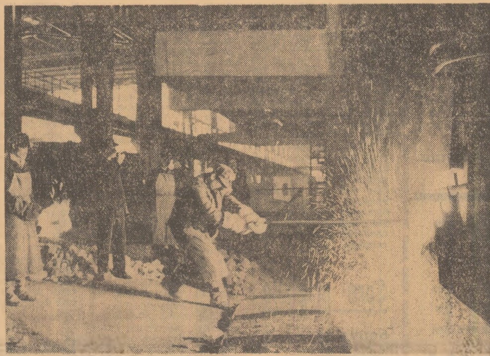
Pe platforma cuptorului electric numărul 1 de 50 tone, de la noua Uzină metalurgică din Capitală, se urmărește procesul de elaborare a unei noi șorje.