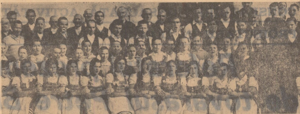
Corul din satul Ceauș, raionul Tîrnăveni, împlinește 130 de ani de existență. Acum, în componența sa intră 170 de persoane.