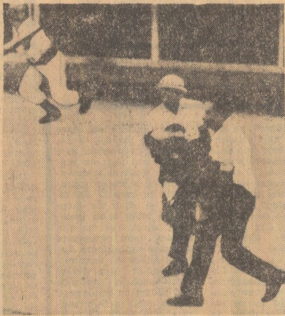
Pe o stradă din Managua în timpul ciocnirilor

Timp de două zile, Managua, capitala statului Nicaragua, a fost teatrul unor violente incidente care s-au soldat cu 32 de morți și peste 100 de răniți. Duminiu, în timp ce peste 50 000 de persoane participau la o demonstrație înaltă de opoziție, armata a deschis focul asupra mulțimii. La Palatul prezidențial au fost amplasate tancuri și mitraliere, iar deasupra orașului s-au ridicat avioane militare. Luni, ciocnirile de stradă dintre trupele gărzii naționale și civili înarmati au continuat. Răsculțatul, reprezentînd forțele de opoziție, au ocupat un hotel din centrul capitalei. Tancuri și mașini blindate au fost aduse la fața locului, iar aviația a mitraliat cîteva cartiere. Ultimele știri sosite din Managua anunță că autoritățile au reușit marți să restabilească controlul asupra orașului.