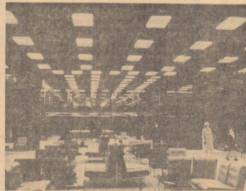
Un interior plăcut, atrăgător (Holul hotelului „Carpazi”-Brașov)