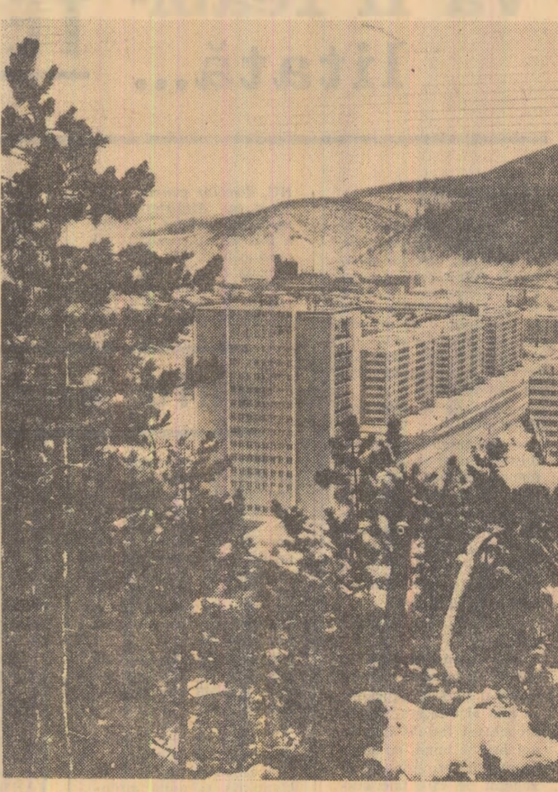
Piatra Neamț, azi