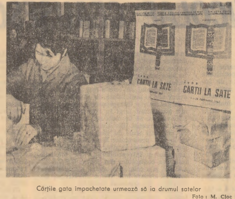
Cărțile gata împachetate urmează să ia drumul satelor.