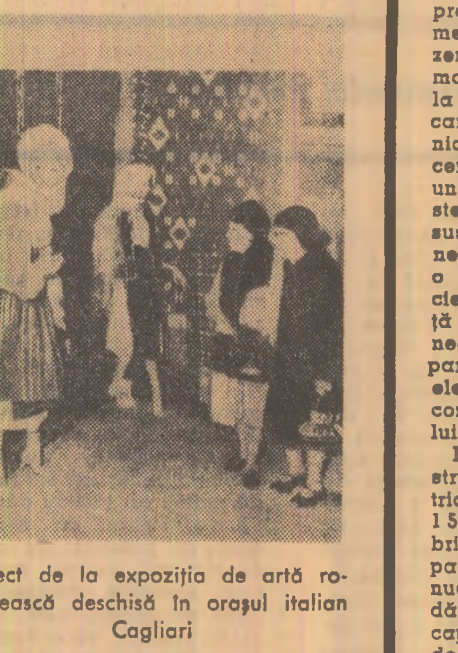
Aspect de la expoziția de artă românească deschisă în orașul italian Cagliari

laritatea de a produce mai mult material fisionabil decît consumă, permițînd astfel rezolvarea problemei resurselor mondiale de uraniu. PARIS. În regiunea Antarcticii a fost lansată cu succes prima rachetă de cercetări, Racheta, de tipul „Dragon”, a fost lansată de pe baza franceză Dumont d'Urville din secțiunea Adèle, în imediata apropiere a Polului magnetic sudic, în cadrul unui program de cinci lansări, pentru efectuarea unor măsurători magnetice de înaltă altitudine. BAGDAD. Ziarul „Al Jumhuri” relevă că președintele R.A.U., Gamal Abdel Nasser, a trimis un mesaj președintelui irakului, generalul Abdel Rahman Aref, în legătură cu apropiata reuniune a Comandamentului politic comun irako-egiptean. Însărcinat să examineze problemele de primă urgență ce interesează cele două țări. WASHINGTON. Satelitul meteorologic „Eos-4” lansat vineri de la baza aeriană Vandenberg (California), a transmis simbiată prima sa fotografie. Imaginea lăstă deasupra nordului Oceanului Atlantic nu este prea clară, datorită perturbărilor cauzate de furtunile de zăpadă căzute în ultimele zile în regiunea Marilor Lacuri.