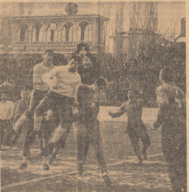
Duminică s-au desfășurat în Capitală două meciuri amicale de fotbal. Pe stadionul Dinamo, echipa Dinamo București a terminat la egalitate (0-0) cu Steaua, iar pe stadionul Culești, Rapid a învins cu 2-1 (2-1) pe Progresul București. În fotografie: dinamoviștii în fața porții Stelei.

Leverkusen (R.F.G.); Spartakus Budapesta—Jalghiris Kaunas (U.R.S.S.) 8-7 (2-0); S.K. Leipzig—Prodavka Koprivnica (Iugoslavia) 15-8 (6-3); Volei feminin: Akademik Sofia a învins pe S.K. Leipzig cu 3-1. S-a calificat însă S.K. Leipzig care câștigase primul meci cu 3-0.