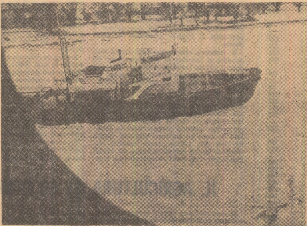
„Voinicul” în luptă cu ghevrurile Dunării

Complexul va mai cuprinde un camping, format din căsuțe prefabricate și corturi, o terasă desoperită, un grup sanitar, precum și un spațiu de parcare pentru mașini. (Agerpres)