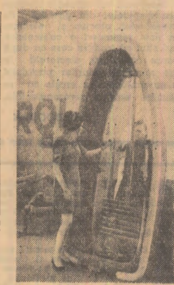
La Salonul internațional al ambarcațiunilor pentru distracții de la Paris a fost prezentată și această barcă pliantă cu fundul din plexiglas, care permite pasagerilor să vadă ce se întîmplă sub apă

Cu oțșiva ani în urmă hidrologii au stabilit că rechinii din regiunea Gronlandei care au ochi foarte strălucitori, îi folosesc ca un fel de faruri pentru a-și ademeni pradă — pești curioși pe care îi fascinează. Această constatare a fost valorificată de pescarii japonezi, care au atașat la plasele lor ghirlandă de becuri sau inele acoperite cu un strat luminescent. Rezultatul a fost extraordinar, mai ales când pentru atragerea peștilor s-au folosit brillante minuscule.