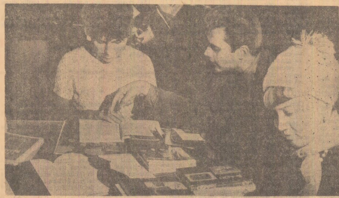
Studenți creștoveni la Casa de cultură

de acoperire și cade, fatal, în formalism. Din păcate, modul în care unii artiști urmăresc integrarea marii tradiții a folclorului românesc se înscrie tot sub semnul simplitii experiment formal, exterior. Unii descoperă arta noastră populară, din afară, asemenea unui univers exotic și o citează în fragmente dispartate care își pierd semnificația. Un briu românesc ca în „Crasovenca” lui Ion Stendel, un joc de pătrate, ca în velența din leagănul înfățișat în „Maternitate” lui Ion Grigore sau chiar un costum întreg, ca în portretul Adinei Colocescu, simplificările și stilizările căutate naive sînt tot atît de departe de tradiția picturii noastre cît este și tabloul lui H.