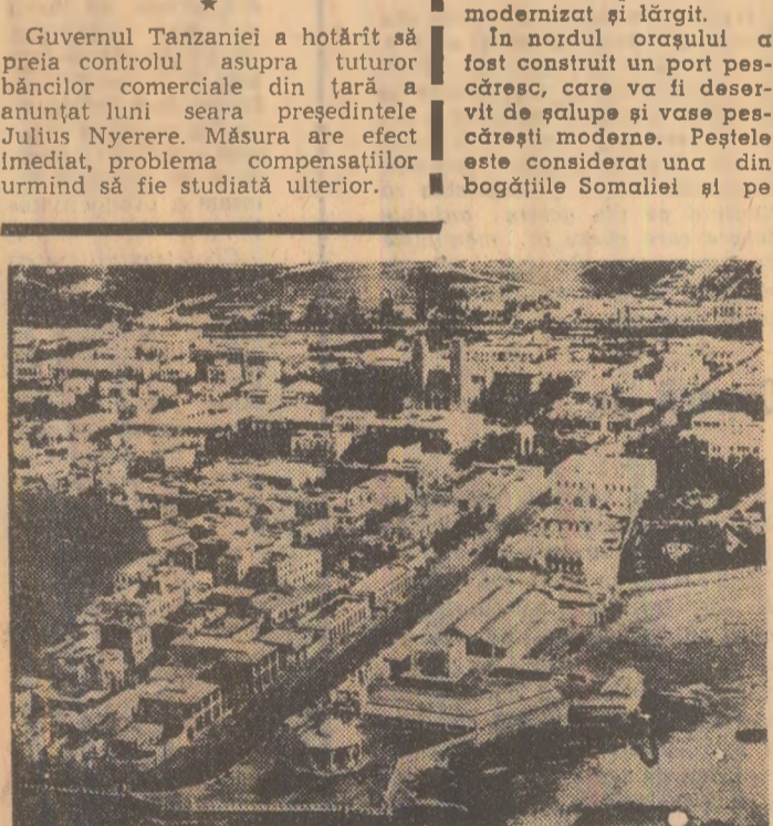
Vedere din Mogadiscio

DAR-ES-SALAAM 6 (Agerpres). — În capitala Tanzaniei a avut loc duminică o adunare populară la care au participat peste 70.000 de persoane și în cadrul căreia președintele Julius Nyerere a rostit o cuvîntare radiodifuzată, expunînd principalele puncte ale programului de dezvoltare economică a țării, adoptat în reuniunea din 29 ianuarie de către conducerea Uniunii naționale africane (T.A.N.U.), partidul de guvernămînt. În mod deosebit, prezintă agenția Reuter, președintele Tanzaniei a accentuat asupra necesității de a fi traduse în practică directivele planului de cinci ani, menționînd că acestea trebuie să fie îndeplinite prin eforturile și resursele interne, fără a se apela prea mult la investițiile sau ajutorul străin. Tanzania, a spus Nyerere, are rezerve mari pentru a dezvolta îndeosebi producția agricolă, capabilă să satisfacă atât cerințele interne cît și cele de export. Guvernul Tanzaniei a hotărît să preia controlul asupra tuturor băncilor comerciale din țară și a anunțat luni seara președintele Julius Nyerere. Măsura are efect imediat, problema compensațiilor urmînd să fie studiată ulterior.