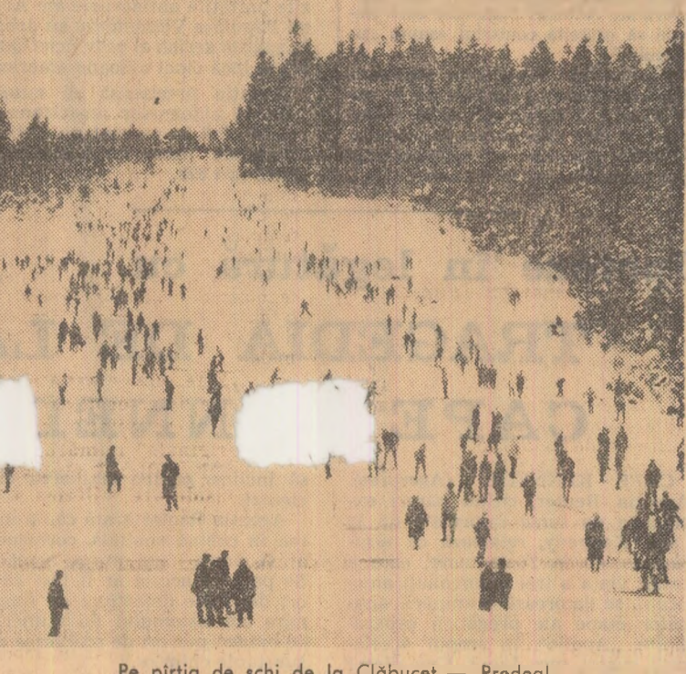
Pe pîrtia de schi de la Clăbucet — Predeal.

Categoria I: 1 variantă a 105.088 lei; categoria a II-a: 2 a 45.037 lei și 6 a 11.258 lei; categoria a III-a: 99 a 1.551 lei și 146 a 387 lei; categoria a IV-a: 458 a 441 lei și 550 a 110 lei; categoria a V-a: 754 a 310 lei și 1.051 a 77 lei. Premiul de 105.088 lei a revenit unui participant din Suceava.