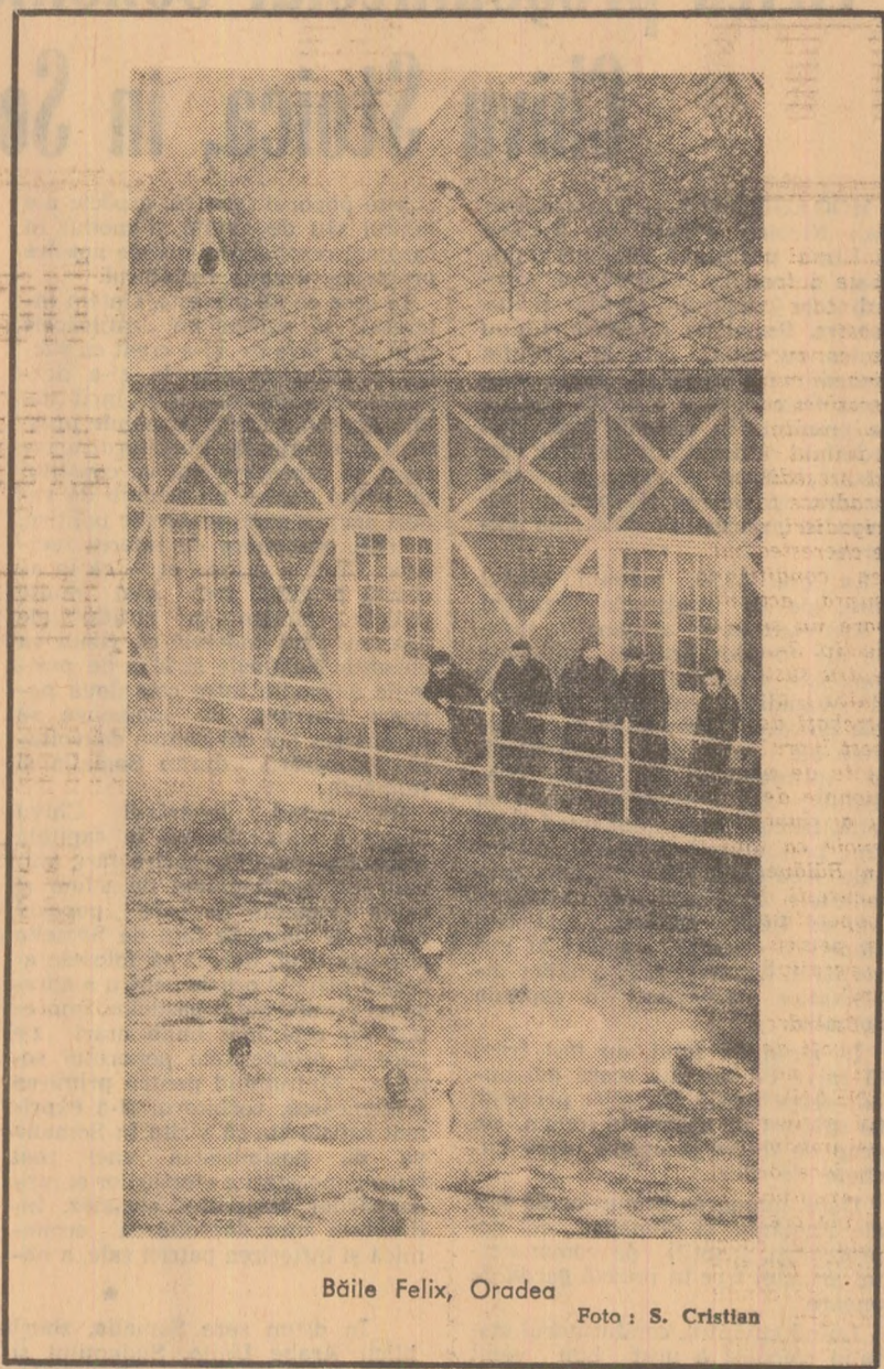
Băile Felix, Oradea

Rubrică redactată de Ștefan ZIDARIȚĂ Ștefan DINICĂ cu sprijinul corespondenților „Scinteii”