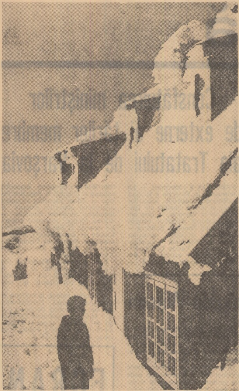
In aceste zile la cabana Omul