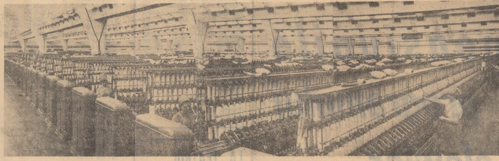
În secția filatură a fabricii „Furul roșu” din Tâlmaciu

Păsările valorifică în modul cel mai rentabil furajele numai atunci cînd acestea sînt date în cadrul unei rații bine echilibrate în substanțe nutritive. Dacă se respectă acest principiu, se ivesc