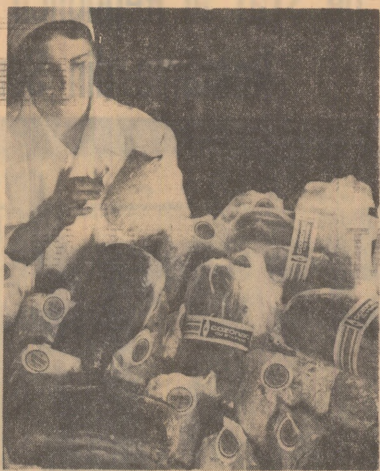
O nouă „șorjă” de cozonaci proaspeți la Intreprinderea de panificație „Steagul Roșu” din Capitală