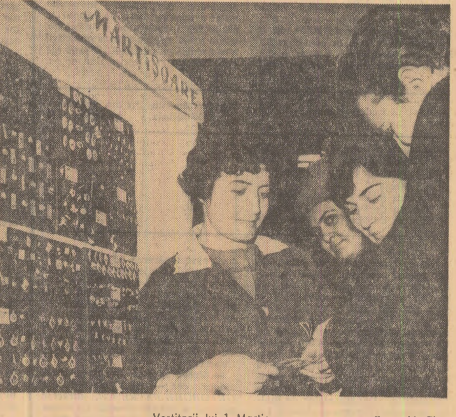
Vestitoriul lui 1 Martie