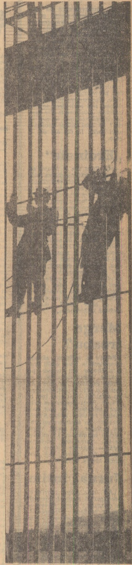
Secvență de pe șantierele Sistemului hidroenergetic și de navigație Porțile de Fier

Profesorul Emil Racoviță ne expunea la fiecare conferință, în care graul său moldovenesc, molcom, presărat cu arhaisme de cronică și iz de basm, ne-a făcut să-1 (Continuare în pag. a IV-a)