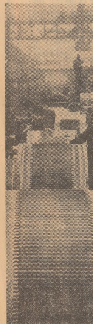
Uzinele „Electroputer”-Craiova, în execuție un nou lot de generatori.

La Combinatul siderurgic Hunedoara se largesc aplicațiile calculatorului electronic în organizarea științifică a producției. După conectarea calculatorului la forfecă rotativă a laminării de semifabricate, optimizarea tăierii, tagelor, s-a sădit ca o creștere a producției de laminat cu circa 5.000 tone anual. În prezent s-a trecut la experimentarea calculatorului în controlul disciplinei contractuale, la producția de laminat. Cu ajutorul lui se urmărește zilnic realizarea cantității, calității și pe sortimente a prevederilor contractuale față de sutele de beneficiari. În acest fel, se asigură o informare operativă și precisă, care permite cadrelor tehnico-economice să dirijeze în mod științific procesul de laminare și livrare. Se fac pregătiri pentru extinderea utilizării calculatorului electronic și în alte sectoare ale combinatului hunedorean. (Agerpres)