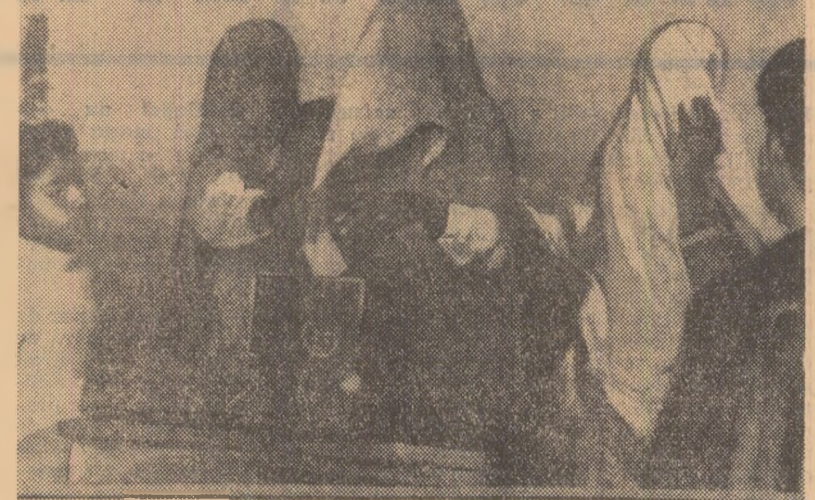
Aspect din timpul votării în localitatea indiană Shahjahanpur

BONN 15 (Agerpres). — Miercuri au început la Bonn convorbirile dintre premierul britanic, Harold Wilson, care este însoțit de miniștrii săi de externe, George Brown, și cancelarul german, Kurt Georg Kiesinger. Bonnul este a patra esclă a premierului britanic în turneul său de sondare a perspectivei aderării Angliei la Piața comună. După cum s-a anunțat miercuri la Bonn, sfera problemei abordate încă în prima zi a tratatelor anglo-vest-germane a fost lărgită, iar oaspeții britanici „nu au găsit la Bonn o atmosferă prea favorabilă sondărilor lor cu privire la intrarea Angliei în C.E.E.”. Rețicențele Bonnului în privința compensațiilor în devize pentru cheltuielile de staționare a trupelor britanice de pe Rin, relatează corespondentul agenției France Presse, „nu au constituit un preludiviu prea încurajator pentru întrevăderile anglo-vest-germane”. În prima zi a convorbirilor în legătură cu eventuala aderare a Angliei la Piața comună au fost abordate „serioasele dificultăți” ridicate de agricultura și balanta de plăți a Angliei”. Interlocutorii vest-germani, relatează din Bonn cercurile politice, s-au limitat să ia cunoștință de punctele de vedere britanice, fără a se angaja să le sprijine față de guvernul francez, care consideră politica agricolă existentă a C.E.E. drept intangibilă.