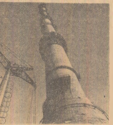
Turnul de televiziune de la Ostankino, de lângă Moscova, în curs de construcție, va avea în final o înălțime de 533 metri

■ ATENA. Comisia parlamentară pentru problemele interne a aprobat, cu 17 voturi pentru, 5 contra și 2 abțineri, noul proiect de lege privind introducerea sistemului electoral proporțional simplu. A fost un vot de principiu, dar se consideră un preludiviu pozitiv al discutării proiectului de lege în cadrul sesiunii parlamentare.