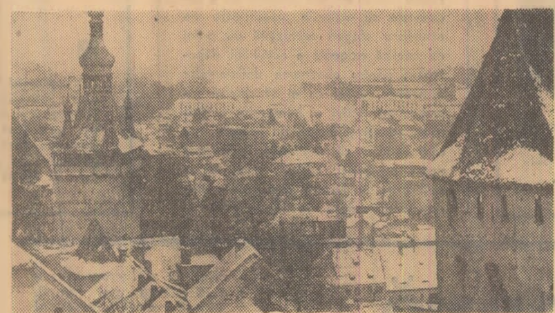
Centururi în alb la Sighișoara