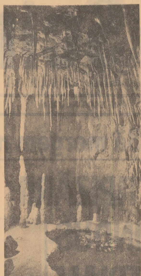
Nou peisaj speologic. Secvență din peștera artificială ce va fi deschisă curînd la Muzeul Antipa din Capitală.