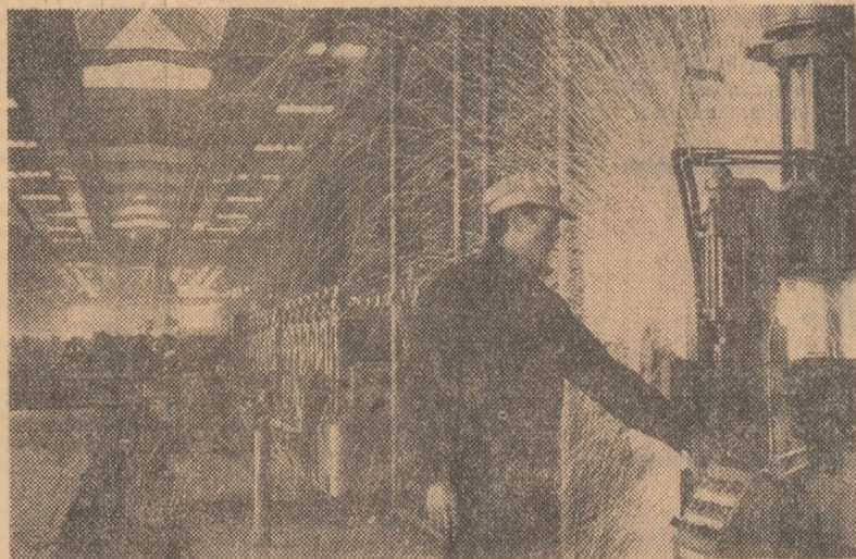
Linia de profile indoite / tablă a uzinei metalurgice din Iași