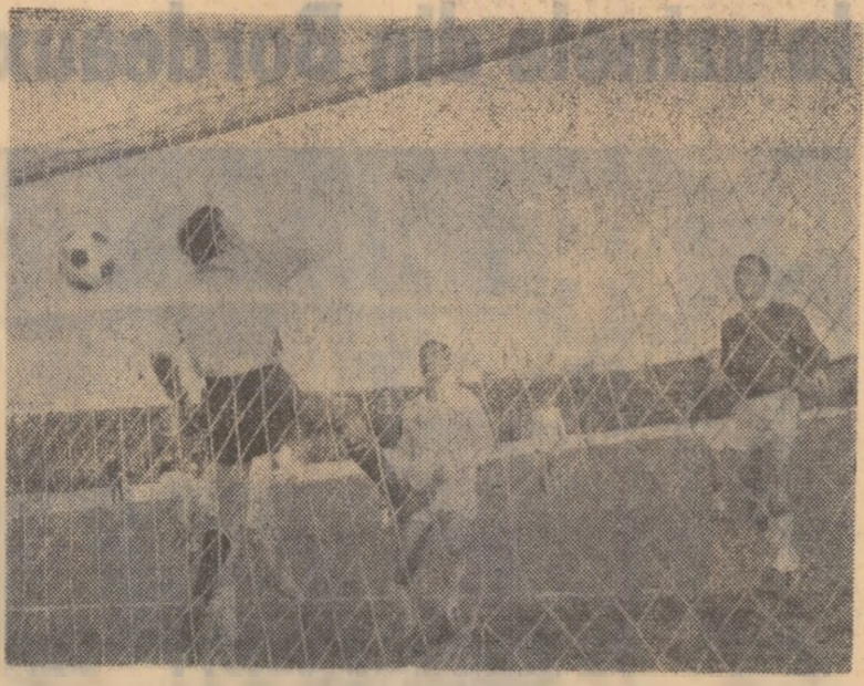
Pericol la poarta echipei iugoslave; mingea, după ce a lovit bara, a ieșit afară (fază din meciul Dinamo Pitești-Dinamo Zagreb)