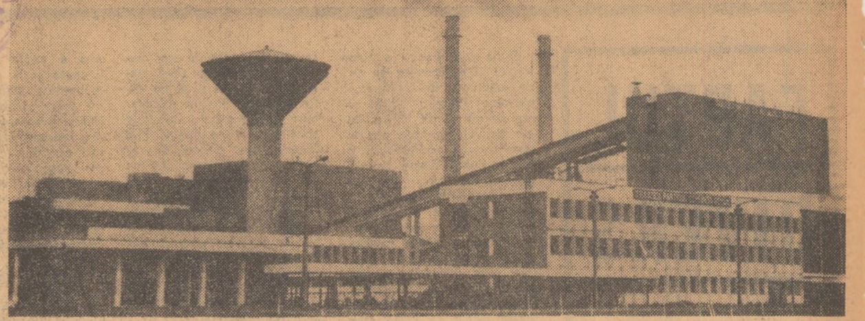
Fabrica de produse refractare silico-aluminoase din Alba Iulia