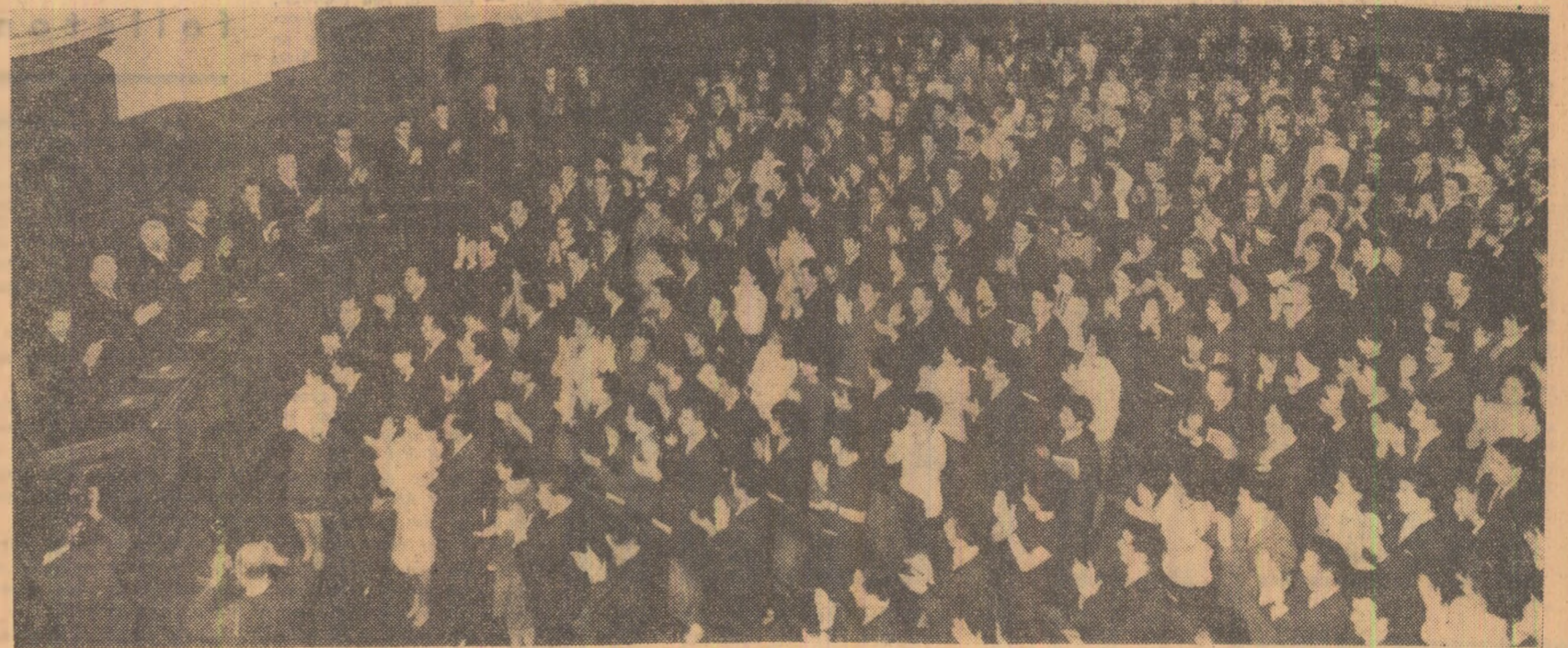
În timpul lucrărilor conferinței

Interviu realizat de Ioan VLANGA, corespondentul „Științei”