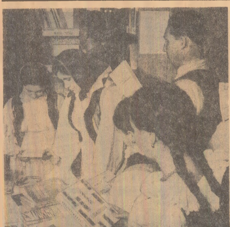
Au sosit cărți noi la biblioteca din Timiș-Crișona