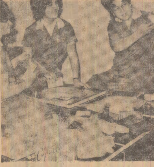
Pregătiri pentru decada cadourilor la magazinul „Eva” din Capitală.

întîmplat incendiul, adică pe teritoriul regiunii Argeș, ca la urmă să se mute la Bacău, pentru că autocamionul aparține de I.R.T.A. Bacău. — Deci pentru drepturile dumitale ai fost trimis din I.R.T.A. în I.R.T.A. Craiova, de unde ai închiriat autocamionul, ce zice? După părerea mea, cu ei trebuie să te judeci. De ce te amestec pe dumneata în buclăria altor I.R.T.E. P... Eu știu că articolul 39 al H.C.M. nr. 491/1958, publicat în Colecția de Hotărîri nr. 26 din 25 iulie 1959, prevede: „Cîrșul răspunde de integritatea mărfurilor primite spre transport din momentul predării pînă la eliberarea către destinatar.” — Ei s-au spălat pe mîini, precum Pîllat din Pont.